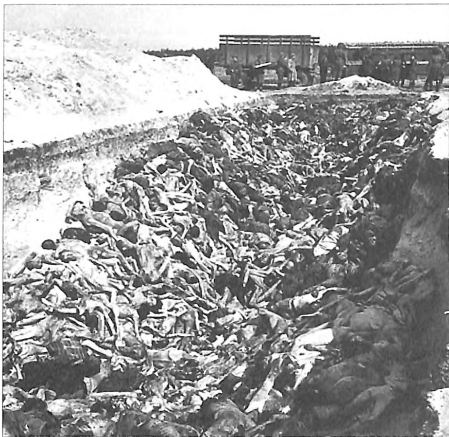
Bergen-Belzen 1945: autor fotografije i reportaže u „Lajf magazinu“ Žorž Rože izjavio je da je to poslednji stadijum ljudskog srozavanja i da posle ovog prizora nikad više neće moći da fotografiše rat

U logoru je besneo tifus. Nemci su u početku pokušali da izoluju tifusare, ali su posle odustali. Jednog dana je neko došao u kuhinju da mi javi da je moj otac „prestao da se muči“. Sestra i ja nismo znale koji je dan ili datum i uzele smo da to bude 5. april 1945. Pitali su nas da li želimo da nam donesu njegove zlatne zube, što smo naravno odbile. Tih dana je Teo samo sedeo i pio jer je doznao da mu je porodica u Berlinu stradala od bombardovanja. Po tome slutimo da je to bio početak aprila, kad su Amerikanci započeli žestoka bombardovanja i približavali se logoru. Prekinuti su dovod vode i goriva za logor. Vodu smo donosili u kantama, po dvoje, iz rezervoara. Kao ogrevni materijal za kuvanje vode koristili smo drvene donove obuće onih koji su spaljeni u Aušvicu. Bilo je to čitavo brdo. Činilo mi se kao da ih mrtve spaljujemo po drugi put!