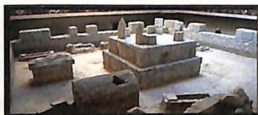
Виминацијум – римски град и војни логор