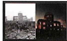
Хирошима после атомске бомбе