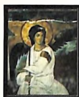
Фреска Бели анђео