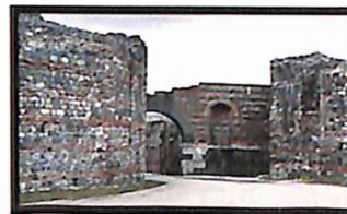
Гамзиград – Ромулијана