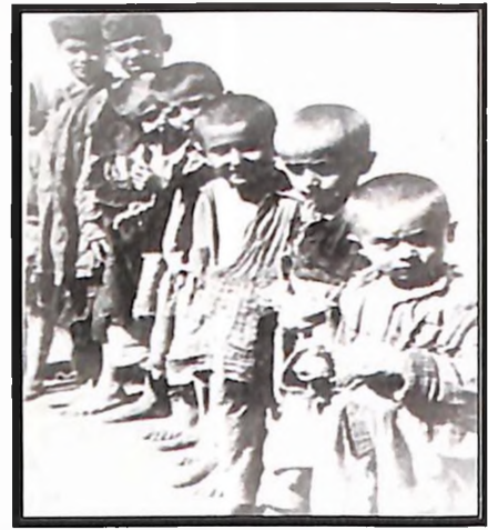
Слика деце у концентрационом логору