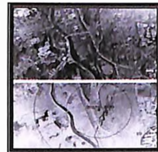
Авионски снимак Нагасакија пре и после атомске бомбе

Други светски рат је завршен после бацања атомске бомбе на јапанске градове Хирошиму и Нагасаки. „Историјско сећање о том ратном сукобу чврсто је остало у свести неколико поколења становништва. Управо то сећање је рађало масовну тежњу становника наше планете да се не доз-