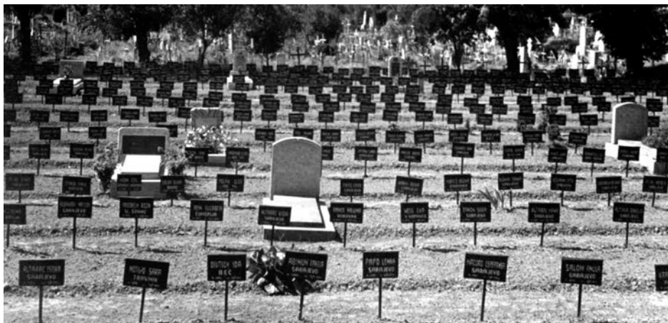
Гробље логорских жртава у Ђакову