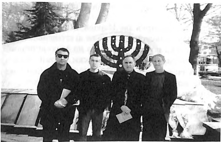
На спомен плочата во Штип – цвеќе за депортираните Евреи

Да. Тоа не се заборава и не може да се заборави. Постојано ќе нѐ навраќа на тоа пишаниот збор и создадените дела како спомени за едно изминато, колективно лудило што ќе остане да живее во срцата на младите генерации и на оние што доаѓаат. За да се сеќаваат. Да не го прават она што малку посеверно од нас го прават и ден-денес лудите господари на војната. Жестоките пци на војната и на вечните страдања на народите.