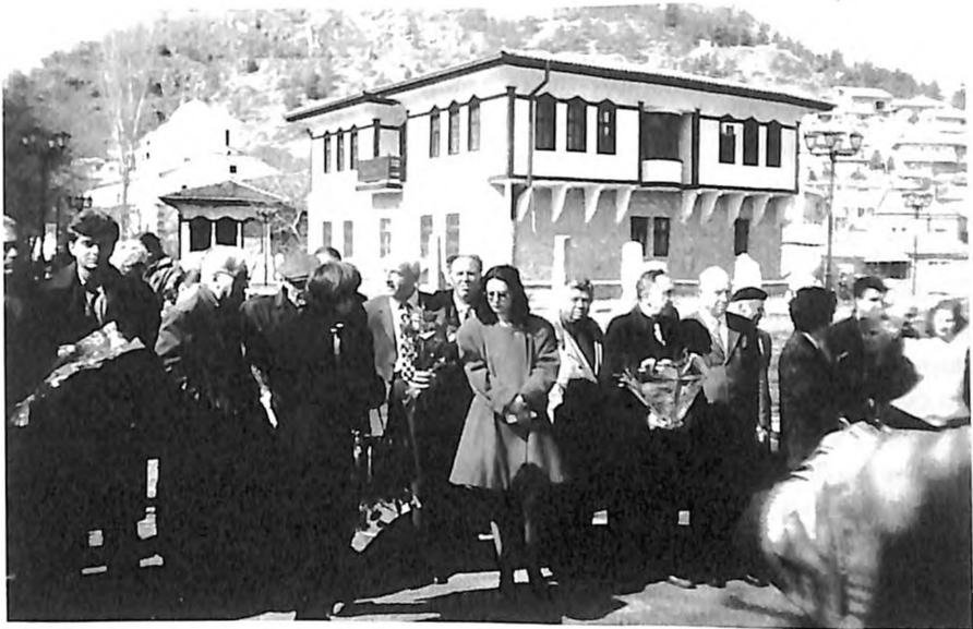
На 11 март секоја година во Штип во знак на сеќавање „Никогаш да не се повтори,,

"Да не се повтори!" - изговараме како во хор, вчудоневидени од неразумноста, бестијалноста, суровоста... Кон своите домови се упативме со мисла што успокојува 'некогаш било, никогаш да не се повтори'.