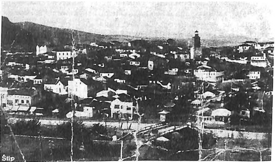
Разгледница од Штип во издание на книжарницата Ассаел и Леви

Непосредно пред Балканските војни во Штип имало 500 Евреи.