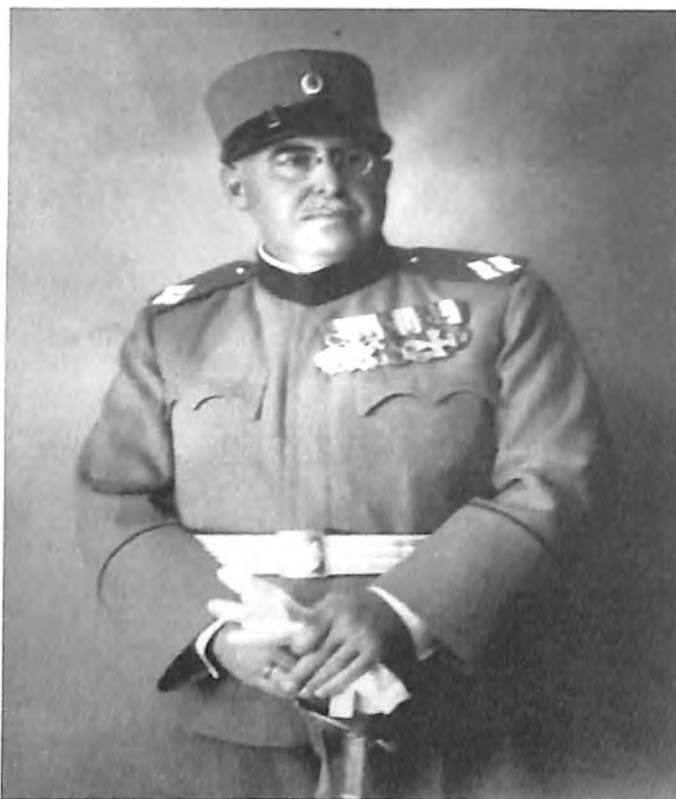
Moša J. Mevorah „Za uspomenu prvog dana rođenja kralja Petra II Kraljevine Jugoslavije“. Beograd 6. septembar 1935. godine.

ne, savremena historiografija pridaje veliku pažnju baš ovakvim, autobiografskim izvorima, jer se time pruža prilika za prevazilaženje proučavanja čisto vojnih ili političkih aspekata rata. Tada se otkrivaju emocije savremenika, njihova razmišljanja i snalaženja u velikim događajima istorije.