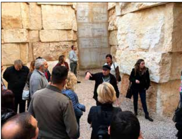
Полазници семинара у Јад Вашевом меморијалном комплексу „Долина заједница”

Завршни догађај споменутог пројекта Међународна библиотечка њајлјформа за образовање о Холокаусту одржан је у децембру 2019. године у Народној библиотеци Србије, када је упрличен међународни семинар Библиотечари, архивисти и нови међународни извори за предавање и учење о Холокаусту . Осим представника институција из Србије, његови учесници били су и стручњаци из Пољске, Холандије, Немачке, Израела, Сједињених Америчких Држава, Аустрије, Македоније и Шпаније. 9