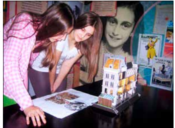
Детаљ из радионице „Читамо и ишлемо са Аном Франк“

У тим активностима, важну улогу често је имала невладина организација Тераформинг из Новог Сада, посвећена унапређивању образовања о Холокаусту и борби против ксенофобије, 2 која је, захваљујући разгранатој мрежи сарадника и пројектним активностима широм Европе, имала капацитет да одигра улогу посредника у међуинституционалној сарадњи. У координацији са Кућом Ане Франк из Амстердама, представници ове организације су на српски језик превели и припре-