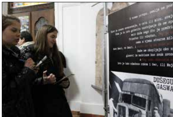
Детаљ са изложбе „Писање страдања”