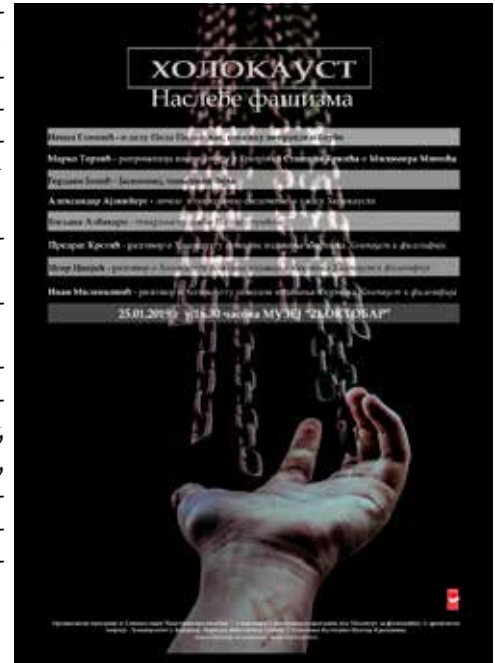
Рекламни плакај за први програм „Холокауст: наслеђе фашизма”

Један од таквих пројеката свакако јесте репозиторијум Јеврејска дигитална библиотека 11 , чије је стварање започело пред крај 2019. године. Иза њега стоји истоимено непрофитно невладино удружење, основано ради прикупљања, представљања, афирмисања и очувања јев-