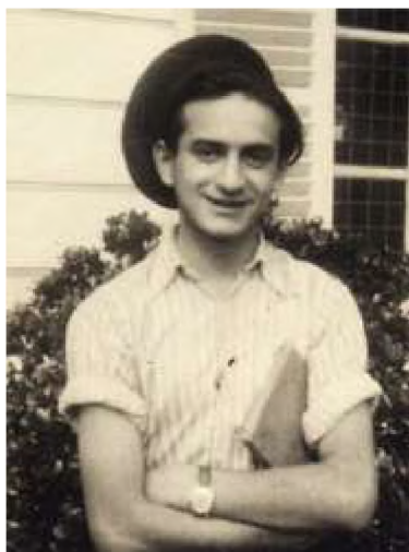
Elie Wiesel s 20 godina

“ Za preživjelog koji se odlučio svjedočiti, sve je jasno: dužnost mu je svjedočiti o mrtvima zbog živih. On nema pravo da buduće generacije liši prošlosti koja pripada našem kolektivnom pamćenju. Zaboraviti nije samo opasno već i uvredljivo; zaboraviti mrtve bilo bi kao ubiti ih po drugi put. " Noć 1956.