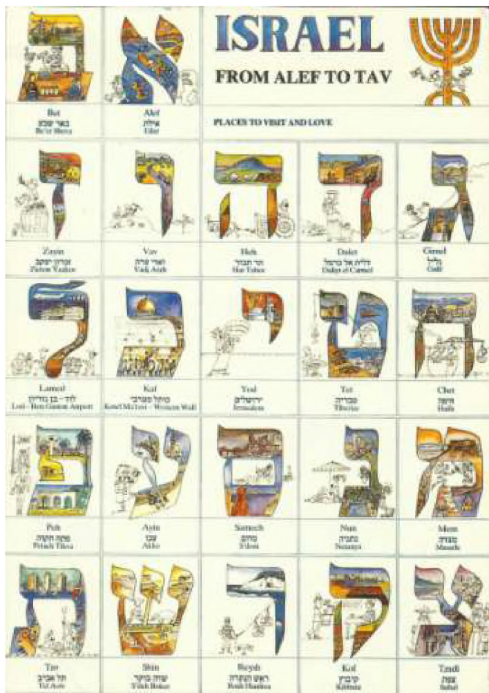
Alef Bet i gradovi Izraela

U 2. stoljeću ili nešto kasnije, većina je Židova koje su Rimljani iselili nakon što su okupirali Judeju i srušili II hram, prestala koristiti hebrejski jezik u svakodnevnom govoru. Ipak postoje neki dokazi, da je manja grupa Židova, koja je ostala u Tiberijasu i Cefatu govorila hebrejski u 8. stoljeću. I u vremenu, kada hebrejski jezik nije bio govorni jezik, Židovi su ga generacijama koristili kao svoje glavno pismo, osobito za pisanje sudskih protokola, vjerskih zakona, biblijskih tumačenja i još. Često su se i poslovna pisma i ugovori pisali na hebrejskom jeziku. Zanimljivo je to, da su su vjerski propisi za žene, u aškenaskim zajednicama, pisani na jidišu, jer žene, za razliku od muškaraca, nisu učile hebrejski.