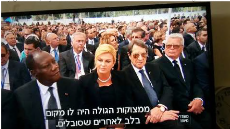
Hrvatska predsjednica među svjetskom političarima na pogrebu Šimona Peresa

Boriti se za mir a toj rastrganoj zemlji, koju svojem smatraju i Palestinci i Izraelci, često bez potpore vlasti nije bilo lako. Ipak, zajedno s Yitsakom Rabinom sklopio je u Oslu mirovni ugovor, na temelju kojeg su oba, zajedno s Jaserom Arafatom dobili Nobelovu nagradu za mir.