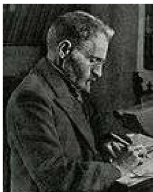
Elieser Ben Yehuda

Hebrew (Ivrit) is a semitic language, and is official language in Israel. Some eight million people speak Hebrew in the world today. Hebrew was replaced by Aramaic as a spoken language in the 6 th century BC. Hebrew was used for religious purposes in Diaspora and Israel throughout many centuries. After 1881 Elieser Ben Yehuda transformed it into a spoken language adding many words from the Bible. It became official language (along with Arabic and English) at the time of British mandate over Palestine in 1921. Most immigrants to Israel already spoke Hebrew and at the time of creating the state of Israel, it was used in schools. It became the official language of Israel (together with Arabic) naturally influenced by Ladino and Yiddish but many other languages as well. Amen and haleluya are often used Hebrew words in many languages. Hebrew is written in letters from Hebrew Aleph-Bet where there are 22 characters, all of them consonants. Vowels are normally omitted