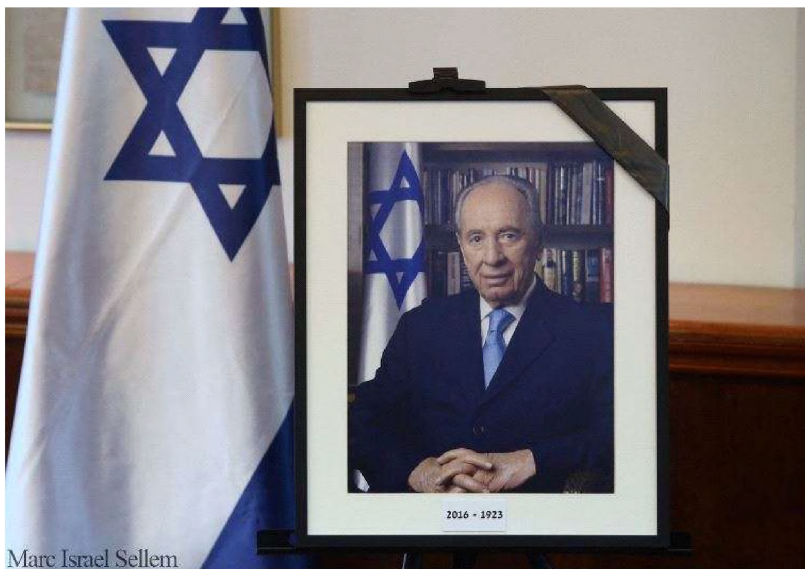
Slika na naslovnici Šimon Perez Cover picture Shimon Peres

Godina / Year 1. Broj / Number 3. Zagreb listopad / October 2016 Izlazi četiri puta godišnje / Published quarterly