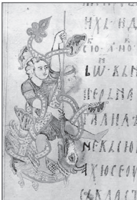
Сл. 12. Мирослављево јеванђеље

Све ове чињенице, казивања и сведочења о Јеврејима Мојсијево и православне вере који су живели у Крушевцу, могу допринети да се бар мало расветли и сачува од заборава један, па макар и мали део наслеђа из историје овога града. Судбине ових људи и њихових породица су, не само део њихових индивидуалних животних прича, него су и слика једног прошлог времена из целокупне историје Србије.