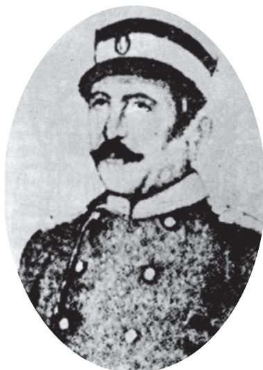
Сл. 1. Капелан Јозеф Шлезингер (1794–1870) 9

де, био је први војни капелник и композитор војничких маршева у Србији. 7 На захтев кнеза Милоша Обреновића 1831. године долази у Крагујевац, где оснива тзв. „Књажеско-србску банду“, први српски војни оркестар. 8