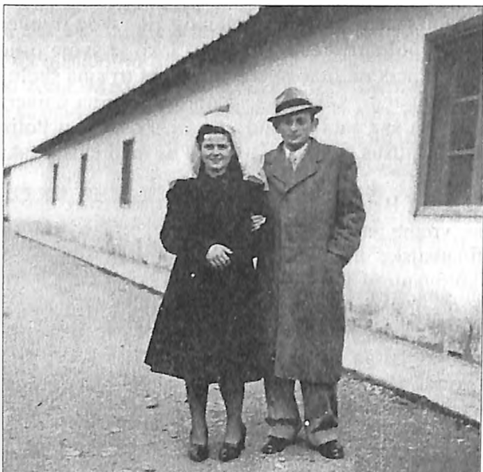
Poznanstvo i ljubav u logoru Feramonti završila se venčanjem, po jevrejskom rituale (fotografija sa venčanja, 1943. godine)