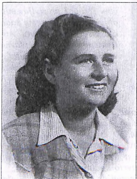
Frida, 1939. godine

Kao veoma mlada postajem aktivna u jevrejskoj omladinskoj organizaciji Trumpeldor. To je već vreme kada se naslućivalo da će doći do rata, pa smo na sastancima odlučili da ćemo otići u Palestinu. Nismo imali nikakvih posebnih dokumenata. Nas 550 žena, dece, staraca i omladinaca iznajmili smo brod koji se zvao „Penčo“ i krenuli Dunavom 1939. godine. Brod „Penčo“ je bio, u stvari, olupina namenjena za prevoz stoke i bez ikakvog komfora. Kad smo stigli do Kladova, nismo mogli da nastavimo put. Stajali smo u Kladovu mesec dana bez sredstava za život. Međutim, Savez jevrejskih veroispovednih opština Jugoslavije saznao je za naše tegobe i pružio nam pomoć. Mnogo su nam pomogli i seljaci iz okoline doturajući nam životne namirnice onoliko koliko su mogli.