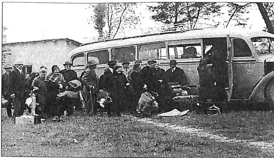
Povratak iz Brezovice u Zagreb 1947. godine

U bunkeru smo pretrpjeli užasan strah i izgubili živce jer smo stalno predosjećali i strahovali da ćemo tamo i završiti životom. Tu smo ostali 10 dana a nakon toga vratili su nas ponovo u one male kućice, gdje su bili naši ostali starci. Kasnije smo doznali da, za ovaj naš spas iz Jankomira, imamo zahvaliti tadašnjem švicarskom konzulu u Zagrebu.