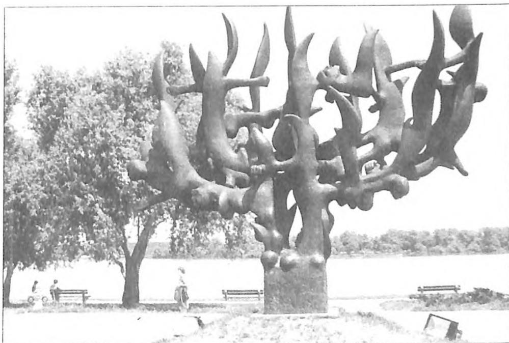
Spomenik beogradskim Jevrejima stradalim u Drugom svetskom ratu, podignut na Dorćolu, na obali Dunava, rad vajara Nandora Glida

Ostao mi je i čuvam jedino ovaj dokument s kojim sam kao Jevrejka preživela u okupiranom Beogradu.