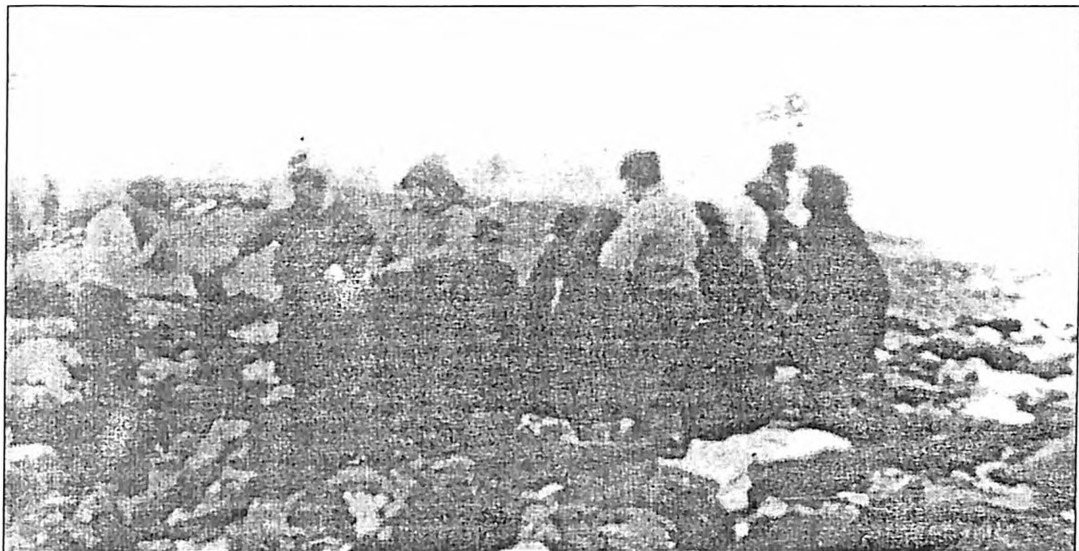
Fotografija broj 2: Došla je naredba da se svi svuku

Sudeći po nabrekloj, raznolikoj hripi odeće koja ih okružuje, svlačenje se vrši u različitim etapama. Slojevi i slojevi džempera, bluza, haljina, gomilaju se. Na kraju, u desnom uglu, stoji jedna tamno obučena, korpulentna žena. Oštri vetar seče njeno lice i mrsi joj poludugačku kosu, i izgleda da gleda u daljinu, u grupu stražara koja stoji na levoj strani, pored nečega što liči na širok jarak ispunjen nečim.