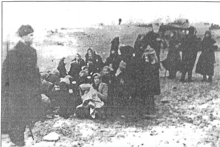
Fotografija broj 1: Očekivanje.

Prva fotografija, u seriji od osam, napravljena između 15. i 17. decembra 1941. u Skedenu, severno od Lijepaje.