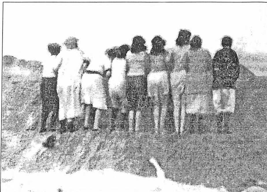
Fotografija broj 6: Postrojavanje na ivici iskopanog jarka.

Grupa od devet žena stoji poredana na ivici donjeg ispusta novoiskopanog jarka. Na dnu slike se nazire ruka. Žene su dobile dozvolu da zadrže donje rublje na sebi. Stoje držeći jedna drugu ispod ruke, okrenute leđima onima koji će za koji trenutak pucati u njih. Treća osoba sa leve strane naginje se čvrsto ka osobi koja stoji desno od nje. Da li želi da se zagreje? Da li hoće da šapne nešto? Ili će se onesvestiti? Druge žene stoje mirno, uzdignute glave, zure ukočeno ispred sebe. Šta vide? Obalu? More? Nebo? Nebo.