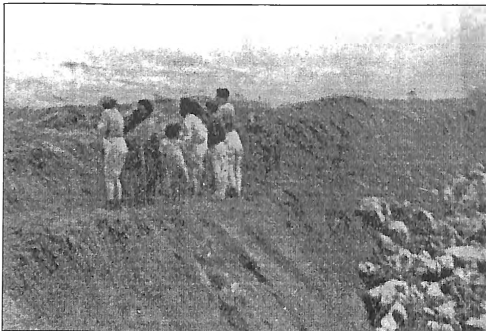
Fotografija broj 7: Nova grupa je došla na isto mesto.

Moguće je da se nalaze samo 10 do 15 metara dalje od mesta na kojem je stajala prethodna grupa. Način je isti. Male grupe, desetak osoba svaki put, sateraju ih na ivicu, prođu pored već ubijenih, poredaju ih. Na istom mestu ubijaju dok se grob ne popuni do ivice ispusta. Tada se dželatni pomere nekoliko metara ulevo.