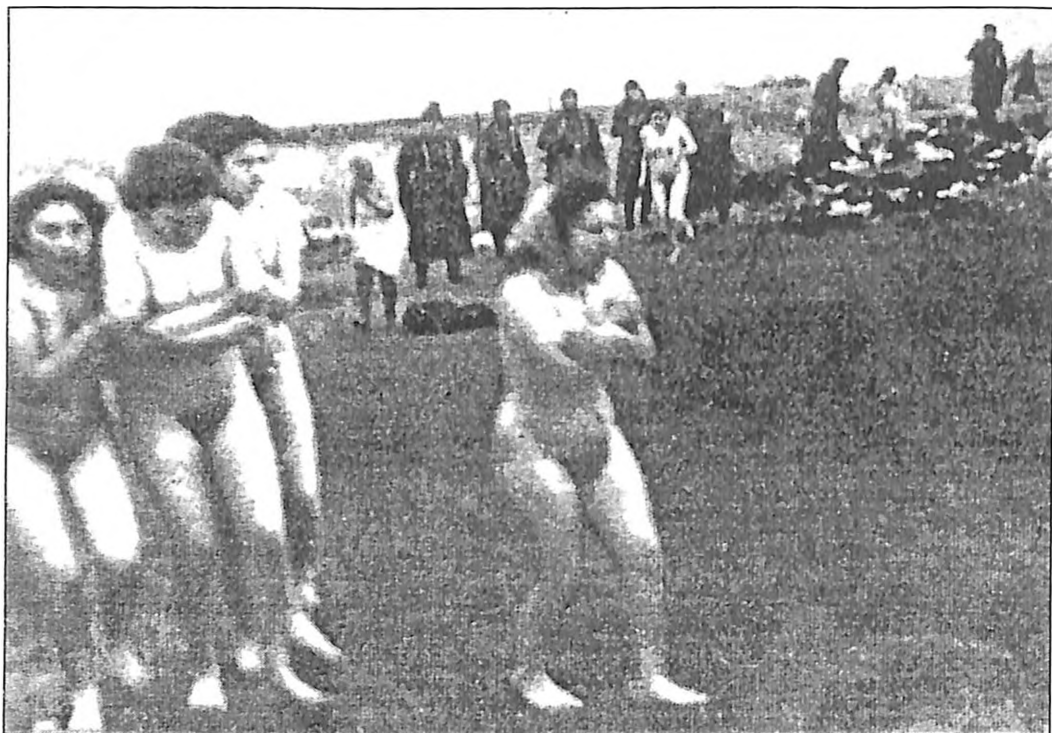
Fotografija broj 4: Na putu ka stratištu

Gole, užurbano trče po pesku udaljavajući se od hrpa sukanja, haljina, bluza, džempera, kaputa i veša, pored gotovo ravnodušnih stražara, ka nečemu što izgleda kao ivica dubokog jarka. Tri mlade devojkje, zbijene jedna do druge, isprepletenih ruku kao da se štite od vetra, ili su uplašene, a možda se i stide, trče iza jedne nešto starije žene. Koraci su sitni i ubrzani. Jedna od njih gleda u zemlju i izgleda kao da pokušava da izbegne da nagazi na nešto oštro. Druga baca pogled pravo u kameru, a treća devojkja, kao i starija žena, zure prema punktu kojem se približavaju. Koliko je još koraka ostalo? 100? 150?