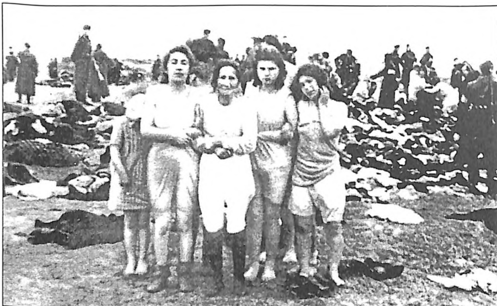
Fotografija broj 3: Svlačenje je već podmaklo

Pet žena stoji u donjem rublju. Izgledaju kao jedna porodica. Majka, otprilike četrdeset godina, drži pod rukom stariju ženu. Majku? Baku? U čizmama je. Pored njih stoje i takođe se drže ispod ruke dve mlade tamnokose devojke. Odmah iza sredovečne žene krije se devojčica, od deset, možda jedanaest godina, bosonoga u tankoj haljinici na štrafte. Jedna osoba iza starijih žena govori devojčici nešto. Devojčici je hladno, drhti zgrčenih ramena u zavetrini iza njih četiri. Devojčica je bosa, ali, da bi izbegla hladnoću peska, stoji na svojim čarapicama.