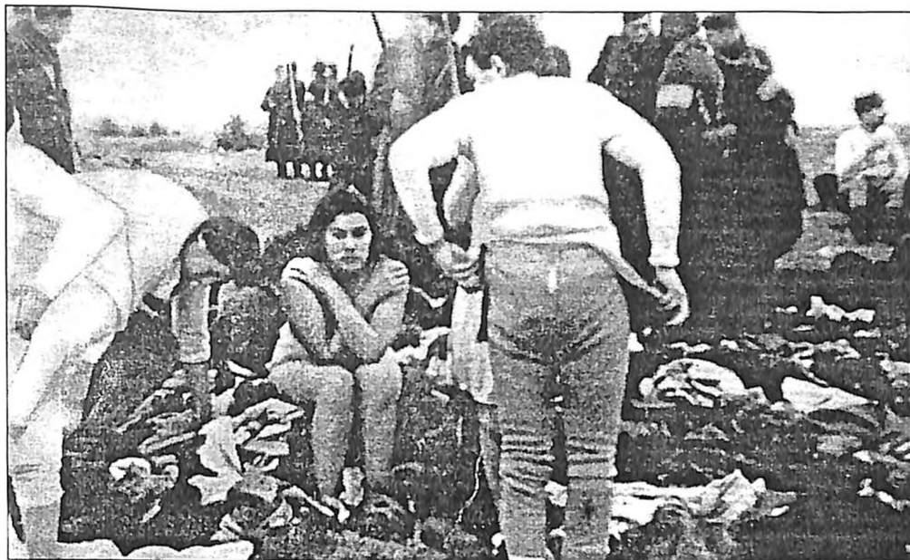
Fotografija broj 4: Svlačenje se približava kraju

Osoba koja stoji u prvom planu je upravo otkopčala dugačke gaće. Ispod njih se vidi još jedan par. Gleda žene oko sebe, nesigurna kako da, u stvari, postupi. Traži nekakav pokazatelj i gleda šta i kako druge žene rade.