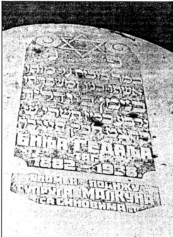
Spomenik na jevrejskom groblju u Nišu.