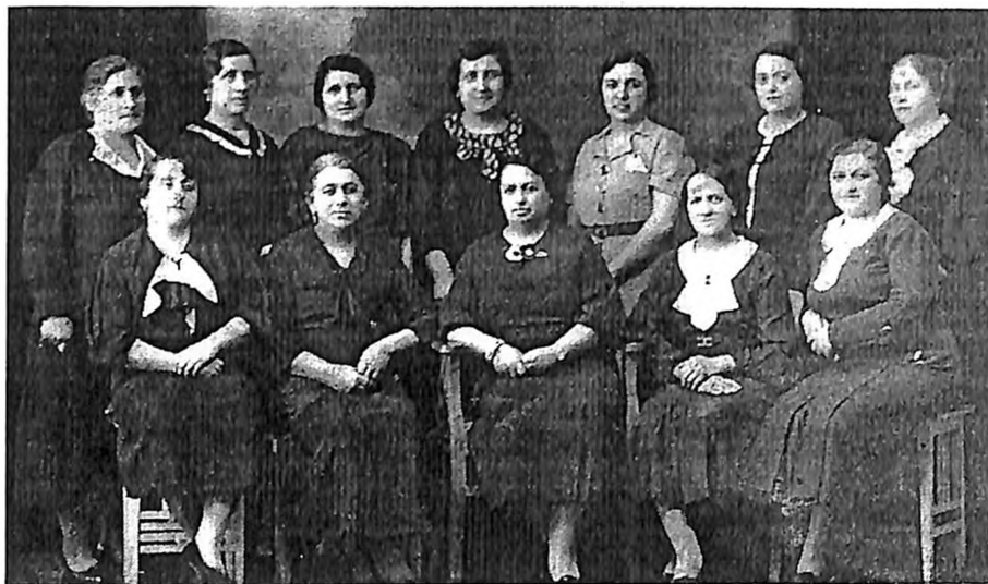
Članice upravnih odbora WIZO (Svetska organizacija cionističkih žena) i "Debore", lokalne humanitarne organizacije, Niš oko 1930, iz arhive Ž. Lebl

Josif Eškenazi, Moša Mandil, Josif Isak, Nisim Isak i drugi." 18