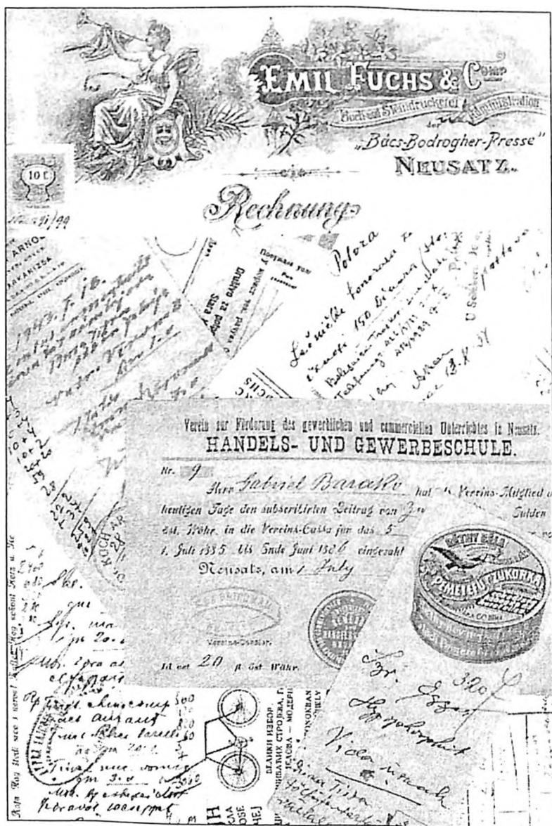
Računi i reklamni leci jevrejskih firmi iz Vojvodine, iz arhiva Jevrejskog istorijskog muzeja u Beogradu

Sve ovo, naravno, ne umanjuje činjenicu da je Josif II bio taj koji je ukinuo obespravljenost i poniženost Jevreja koji su živeli u sramnim uslovima u habsburškoj državi i omogućio im građanski razvitak. Istorija banatskih Jevreja iz XVIII veka ubedljivo dokazuje da su Jevreji habsburške države veoma uspešno koristili mogućnosti koje im je pružio Josif II.