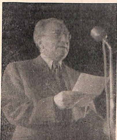
Dr Isak Samokovlija

Dotle popularni sreski ljekar sarajevski, Isak Samokovlija javio se u književnosti kad mu je bilo već trideset i osam godina. Po tome, i što je odmah počeo da daje zrela, nadahnuto pisana i umjetnički sadržajna djela, a osobito što je u bosansku a preko nje u isto vrijeme u književnost Jugoslavije uveo jednu, mada starosjedjelačku, dotad neobrađivanu sredinu i s njom svež dah, način umjetničkog doživljavanja i osoben stil, on znači originalnu i zanimljivu pojavu, jednu od onih koje ocrtavaju razvojni put i bilježe uspon naše savremene književnosti.