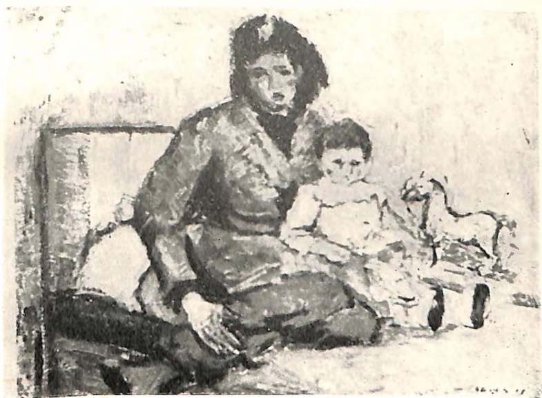
Bora Baruh: Kompozicija (ulje)