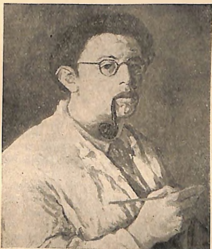
Bora Baruh: Autoportre (ulje)

Bora Baruh se rodio 1911 godine u siromašnoj beogradskoj porodici, koja je osim nje ga dala radničkoj klasi još dva odlična borca, njegovu braću Isa i Jožia, obojicu veoma dobro poznate u studentskom pokretu pre rata, a takođe i beogradskoj političkoj policiji koja ih je svu trojicu često hapsila. (Naziv ulice Braće Baruh na Dorćolu odnosi se na tri brata, koji su svi poginuli u borbi protiv okupatora).