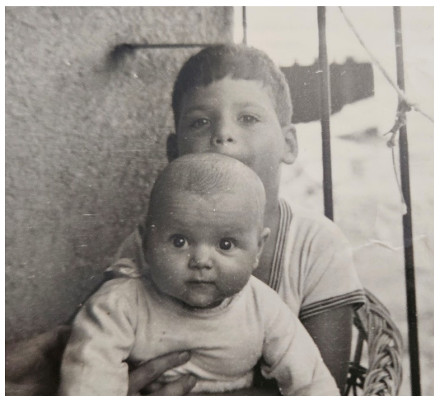
Brat Dejan i ja