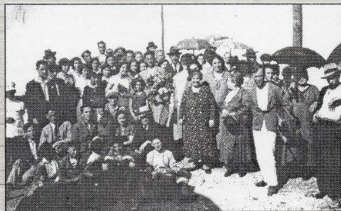
Група фотографија бијељинских Јевреја пред 2. свјетски рат

Бијељинску медицину ушемељио је један Јевреј, Јакоб Кохуи. Рођен је 1836. у Бечу, гдје је завршио медицински факултет и запослио се 1862. г. Ускоро је прешао у шурску војну службу и дошао у Бијељину око 1865. У нашем граду је остао до смрти, шј. до 21. фебруара 1905. г. прво као војни, а иза аустро-угарске окупације као цивилни љекар. Био је дуго времена једини љекар у Бијељини, врло савјестан и хуман човек, што му је донијело велико поштовање од народа у Семберији. Нарочито код српског сеоског становништва био је штолико популаран да је његово име идентификовано са појмом љекара.