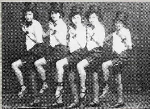
Кабаре-представа у извођењу јеврејских дјевојчица из Бијељине