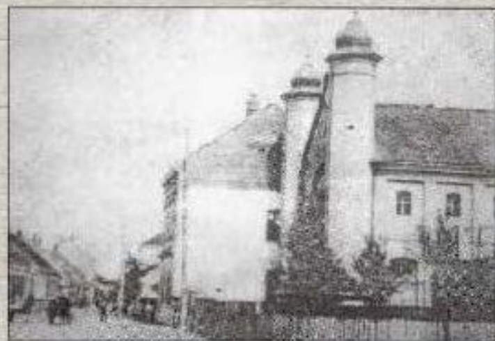
Синагога - почетак XX вијека (данас Ул. Карађорђева на мјесту парка код хойсела "Луна")