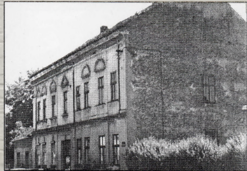
Кућа у којој је становало више јеврејских породица-једни од њих Алкалијеви (данас Ул. Карађорђеви)