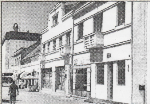
Кућа породице Перера и хоћел "Европа" (данас Финансијска полиција и Дом војске РС)

Јеврејска синагога, импозантне величине и љепоте, налазила се преко њуша Аутобуске станице, у паркићу хоћела "Дрина". Подигнута око 1900. год. имала је два велика шорња на прочељу зграде, лијево поључано и велико двориште. Доласком Нјемца и усташа 1941. зграда је ољачкана и преиворена у коњушницу, али је преживјела рат, да би била срушена од нове комунистичке власти и иако је Бијелина заувјек остала без једне вриједне и репрезентативне грађевине.