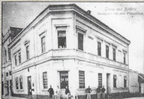
Кућа њородице Вајл-њочешак XX вијека (данас угао Улице М. Селимовића, дио Оишшине)