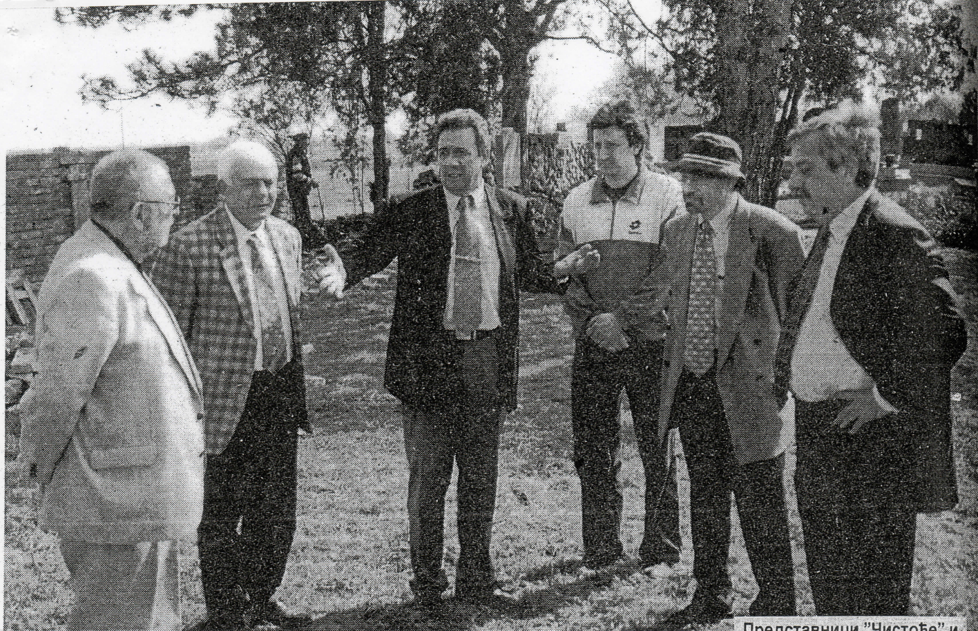
Из ЈКП "Чистоћа"