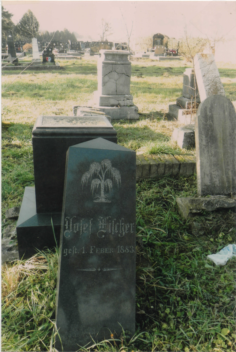
ХАЛЕФ ХИЛШЕР 1883.