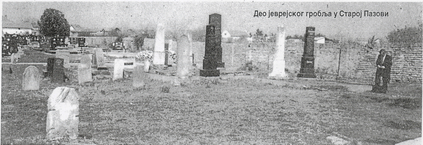
Део јеврејског гробља у Старој Пазови

Земунска јеврејска општина води евиденцију о старопазовачком јеврејском гробљу, а ваљда и о историји Јевреја у Старој Пазови. Иначе, Савез јеврејских општина има око 3.300 чланова, док 90 посто јеврејских гробаља налази се у Војводини. J. V.