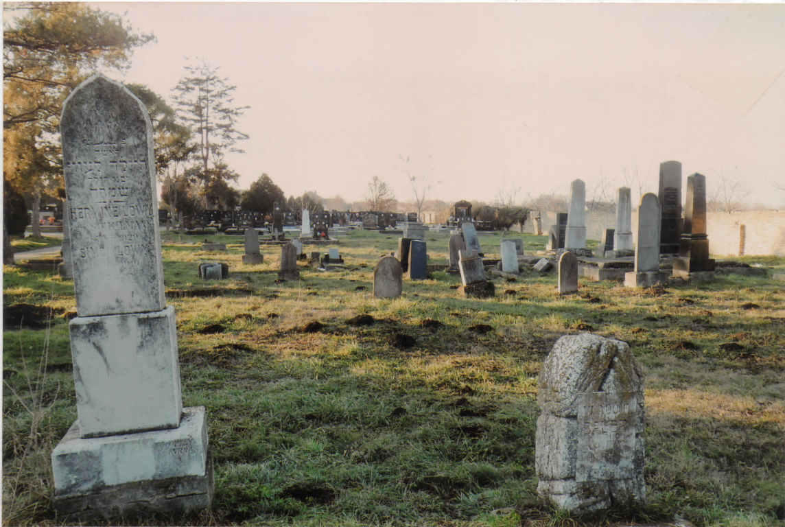
ЈЕВРЕЈСКО ГРОБЉЕ У СТАРОЈ ПАЗОВУ