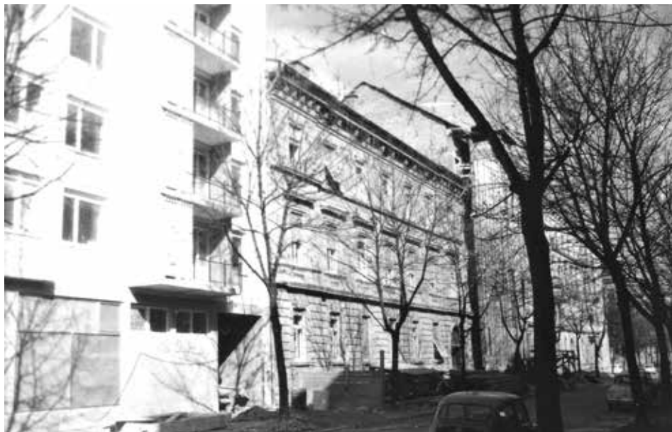
Slika 21: Krekova ulica 18