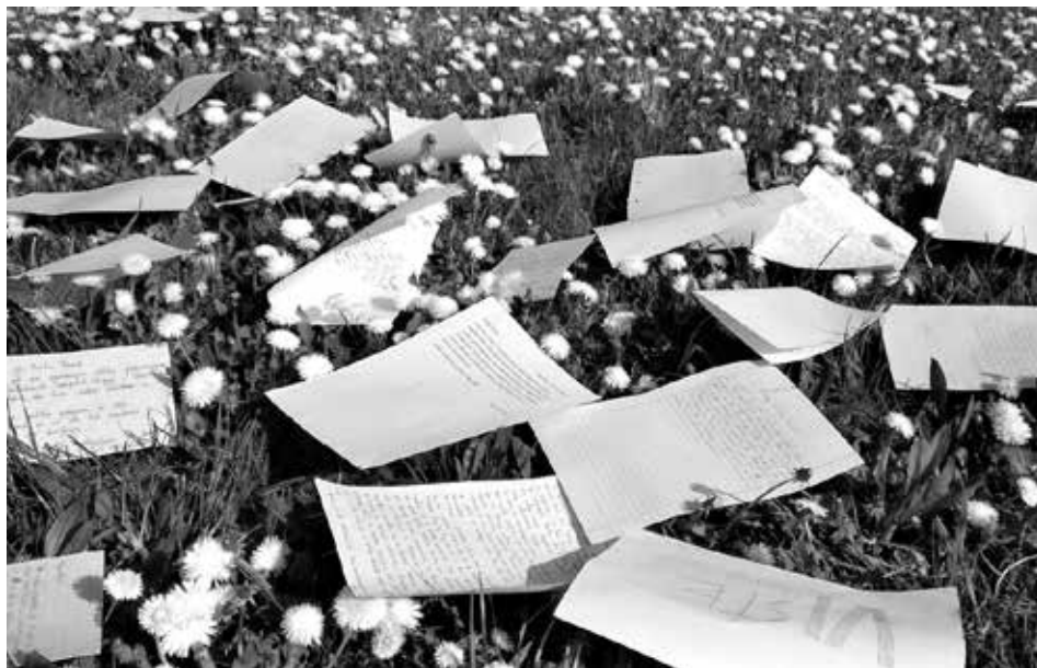
Slika 55: Pisma Eriki med snemanjem v parku v Murski Soboti (Foto: Marjetka Berlič, barvna fotografija)

V nadaljevanju je nekaj odlomkov iz pisem učencev.