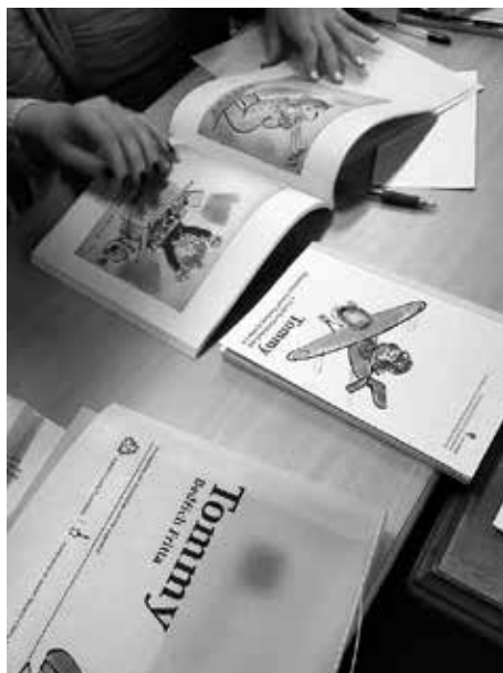
Slika 59: Uporaba didaktičnega kompleta Tommy (Foto: Gordana Rubelj, barvna fotografija)

dečka, ki leti z letalom, vozi vlak, prikazane so različne živali, barve, hrana. Od drugih slikanic se razlikuje le po okoliščinah, v katerih je nastala, in po sporočilni vrednosti.