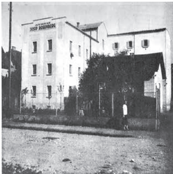
Slika 17: Rosenbergov parni mlin v Mariboru

Na Slovenski ulici 2 je imel pisarno, bil pa je tudi lastnik drevesnice na Tržaški cesti 75, 12 ki se je do leta 1919 in ponovno med nemško okupacijo imenovala Triester Strasse. 13 Na Meljski cesti 37, ki se je do leta 1919 imenovala Mellinger Strasse, prav tako tudi med nemško okupacijo, je imel tudi gospodarsko poslopje oziroma hlev s konji in krmo. 14