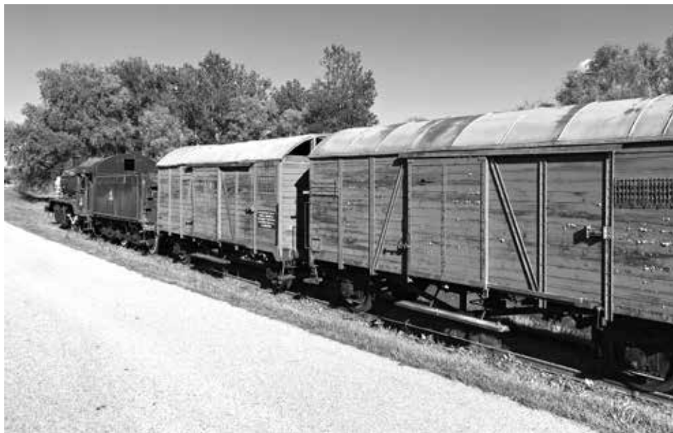
Slika 5: Kompozicija spomen vlaka u nekadašnjem ustaškom logoru Jasenovac III («Ciglana») stoji na mjestu gdje su se zaustavljali transporti sa zatočenicima. (Foto: Aleš Topolinjak, fotografija u boji)

Zaključak iz ekshumacije najstrašnijih leševa je da su stradali od udaraca tupim predmetima zato što su lubanje bile napuknute, zatim zbog smrti gušenjem, smrti vješanjem i rjeđe smrti strijeljanjem. Kod leševa koji na sebi nisu imali ozljeda moglo se pretpostaviti da su umrli zbog gladi ili bolesti. Komisija je nakon istraživanja raka na samom arealu morala prekinuti rad, koji se nastavio tek šezdesetih godina, tako da Jasenovac nije nikada do kraja rasvijetljena enigma. To, naravno, potkrepljuje žongliranje s brojkama žrtava. 96