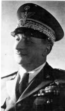
Slika 45: General Giuseppe Amico

Ključne riječi: Dubrovnik, Židovi, zaštita, odmazda