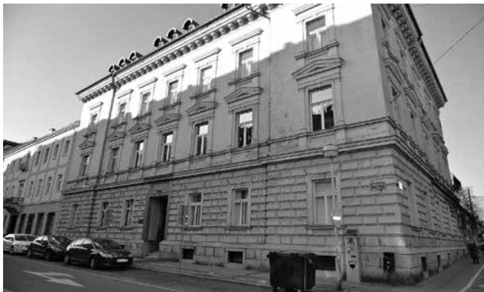
Slika 16: Hiša v Gregorčičevi ulici 12 (vokal Tyrševe 11) v Mariboru, kjer sta živela zakonca Rosenberg.

svetovno vojno so jo Nemci ponovno poimenovali v Schiller Strasse. 6 Današnja Tyrševa ulica je bila od leta 1876 podaljšan severni del Herren Gasse, ki je tako potekala vse do mestnega parka. Ulico so leta 1919 poslovenili v Gosposko ulico, leta 1933 pa se je omenjeni severni del preimenoval v Tyrševo ulico. 7