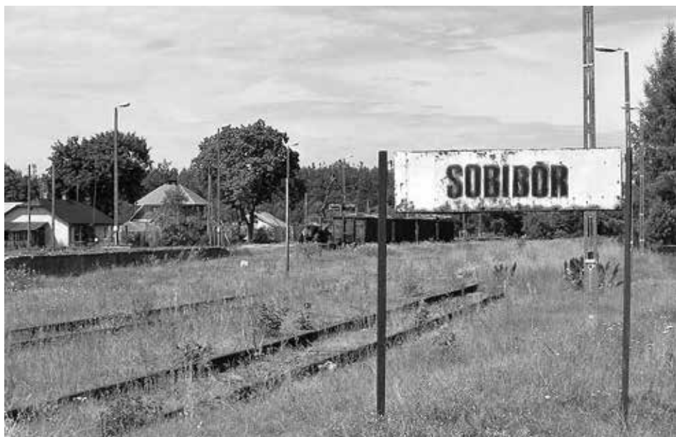
Slika 47: Stara tabla z napisom »Sobibor« ob železniških tirih, ki so vodili v to taborišče.

A že v prvi sceni je opazna tudi velika napaka. Film se začne s prihodom vlaka z novimi zaporniki, novimi žrtvami Sobibora. Vlak naj bi prišel iz Berlina, a to zagotovo ne more biti res, saj direktne železniške povezave ni bilo. Berlinske Jude so v prvih valih deportacije vozili v geto v Lodžu na Poljskem. Do januarja 1942 so deportirali že okrog 10.000 Judov iz Berlina v gete v vzhodni Evropi, večino v Lodž, Rigo, Minsk in Kovno, starejše Jude pa so preselili v Terezín (nem. Theresienstadt). V začetku leta 1942 so berlinske Jude začeli voziti v uničevalna taborišča, predvsem v Auschwitz-Birkenau. 8 Naslednje vprašanje, ki si ga lahko zastavimo, se nanaša na to, od kod so prišli Judje, ki so se znašli v Sobiboru. Odgovorimo lahko: iz cele Evrope, a daleč največ iz Nizozemske. Leta 1939 so Nemci namreč ustanovili taborišče Westerbork v okupirani Nizozemski. Judje, ki so bivali v tem taborišču, so bili večinoma iz Amsterdama. V obdobju med 2. marcem in 8. junijem 1943 je iz taborišča Westerbork odpeljalo 15 vlakov – en vlak na teden – proti Sobiboru. Po pavzi so sledili še štirje transporti, zadnji je odrinil 20. julija 1943. Če povzamemo: iz Nizozemske je v Sobibor odpeljalo 19 vlakov, na katerih je bilo kar 34.313 zapornikov. 9 Judje so v Sobibor prišli tudi iz Francije. Večino francoskih Judov oziroma Judov, ki so se znašli na območju okupirane Francije, 10 so začeli pošiljati v Auschwitz. Nacisti so jih zbirali v tranzitnem taborišču Drancy na obrobju Pariza,