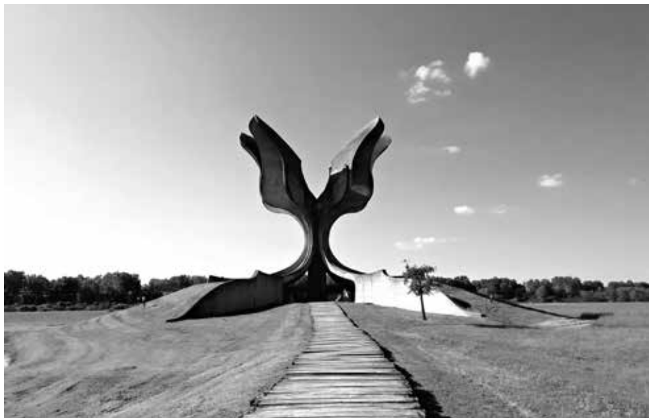
Slika 10: Spomenik »Cvijet« Bogdana Bogdanovića u Spomen području Jasenovac (Foto: Marjetka Bedrač, fotografija u boji)