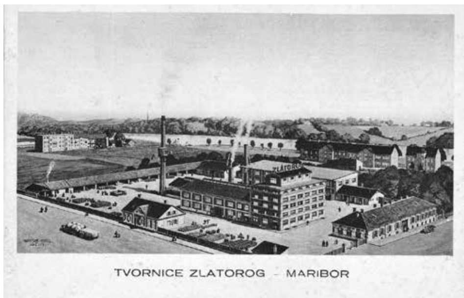
Slika 18: Razglednica tovarne Zlatorog v Mariboru