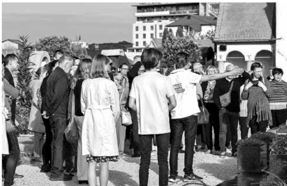
Slika 58: Ob Klarinem grobu, september 2019 (Foto: Dušan Vrban, barvna fotografija)