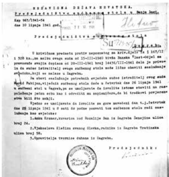
Ilustracija 28: Vlasti NDH su nastavile istragu, ali rezultata nije bilo.