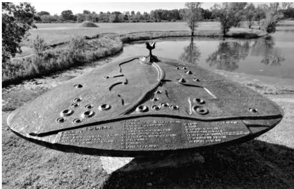
Slika 11: Model spomenika koji se nalazi na putu prema »Cvijetu« s ilustracijom rasporeda baraka u »Ciglani« (Jasenovac III) za vrijeme postojanja logora. (fotografija u boji)