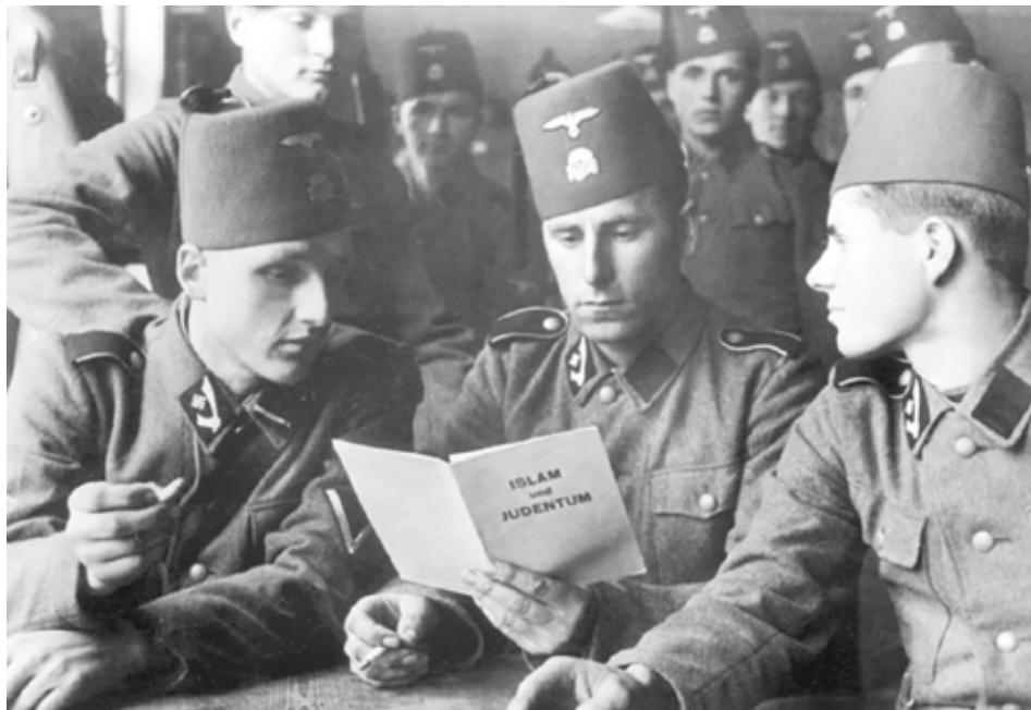
Slika 8: Vojaki 13. divizije SS Handžar prebirajo pamflet Islam in judaizem .

prekličejo ali ignorirajo resolucije, nastrojene proti NDH, ki jih je nekaj mest sprejelo leta 1941. Novembra 1943 je med urjenjem v Nemčiji obiskal tudi samo divizijo Handžar. Za vojake divizije Handžar je napisal pamflet z naslovom Islam in judaizem (nem. Islam und Judentum ), ki se je končal z besedami: »Prišel bo dan sodbe, ko bodo muslimani popolnoma uničili Jude. In vsako drevo, za katerim se skriva Jud, bo reklo: 'Za menoj se skriva Jud, ubij ga!'« 24