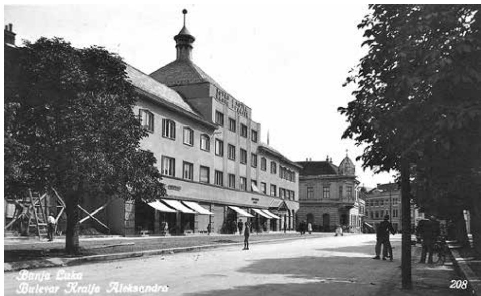
Ilustracija 26: Sa druge strane hotela Palas bila je spratnica porodice Isaka Poljokana zvanog Kučo. Ovo zdanje bilo je prepoznatljivo po kupoli na čijem se vrhu nalazila Davidova zvijezda.