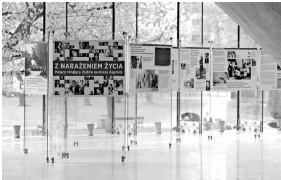
Image 54: “They Risked Their Lives. Poles who Saved Jews during the Holocaust” exhibition at POLIN Museum of the History of Polish Jews in Warsaw. The exhibition makes use of the collection gathered within the Polish Righteous online project, 2014. (Photo: Joanna Król, POLIN Museum of the History of Polish Jews, colour photograph)