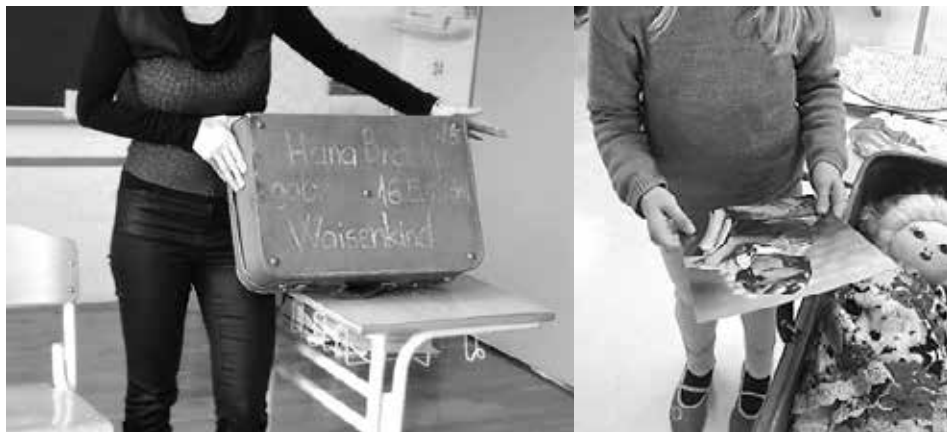
Sliki 62 in 63: Hanina zgodba je oživila s pomočjo kovčka, januar 2018. (Foto: Gordana Rubelj, barvni fotografiji)

Učenje o holokavstu je učenje o življenju za življenje, za današnji čas. V času, ki ga živimo, je za nas učitelje zelo pomembno, da mladim generacijam predstavimo to tematiko tako, da bo spomin na ta del zgodovine tudi opomin današnjemu času.