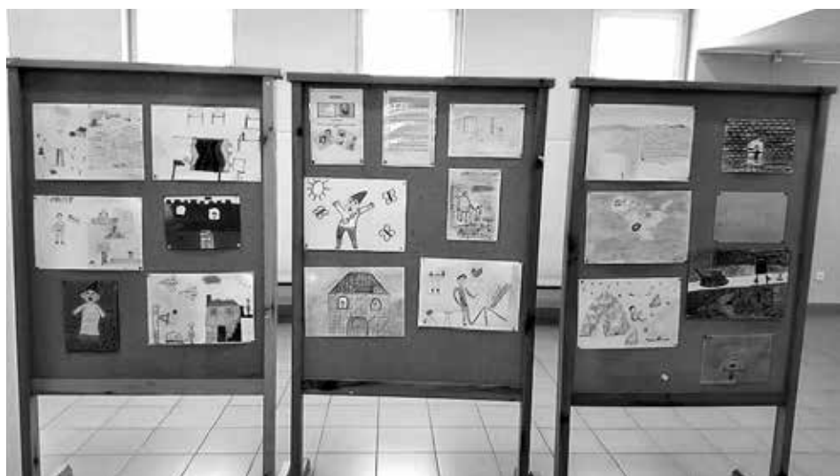
Slika 60: Razstava likovnih izdelkov učencev, ki so spoznali zgodbo o Tommyju, januar 2017.

Po učni uri so nastali tudi likovni izdelki, ki smo jih razstavili v šolski avli.