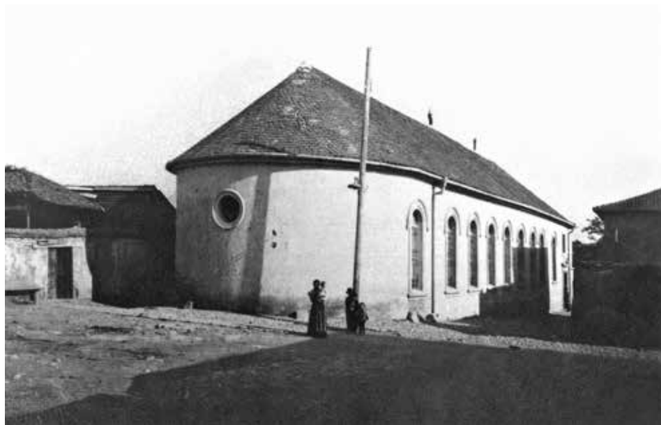
Slika 14: Sefardska sinagoga »El kal vježo« (ili »Stara sinagoga«) u Beogradu srušena je nakon Drugoga svjetskog rata.