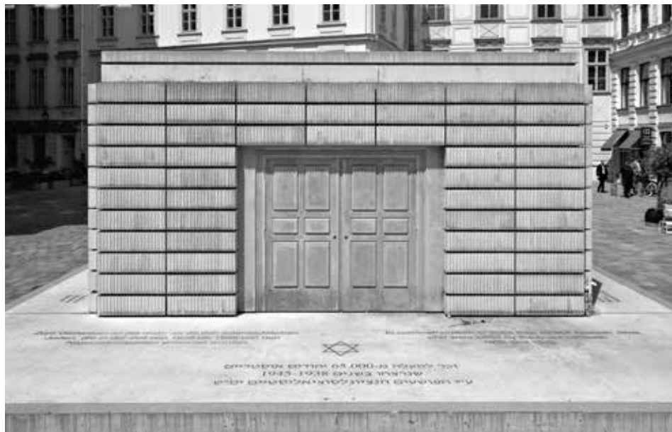
Slika 6: Memorijal Holokausta na Judenplatzu u Beču (fotografija u boji)

Memoari i spomenici bit će u doglednoj budućnosti jedini svjedoci bijega, utočišta i konačnog istrebljenja. U tom smislu shvatila sam i svoj zadatak, a to je opisati sudbine austrijskih i drugih stranih Židova koji su u zabitima Bosne i Hercegovine makar na neko vrijeme našli utočište.