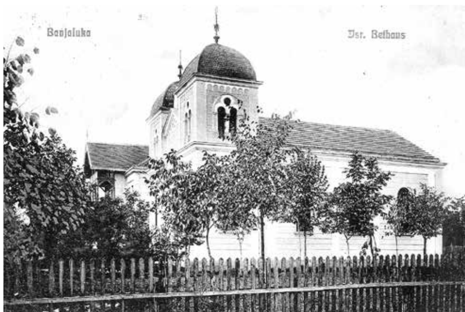
Slika 4: Aškenaska sinagoga u Banjaluci na razglednici iz 1905. godine

Banja Luka imala je, kao i Sarajevo, dvije židovske općine, sa svojim zasebnim hramovima, zasebnim rabinima i zasebnim općinskim životom. Sefardi su u Banju Luku stizali još u 16. stoljeću. Aškenazi su 1883. godine osnovali svoju općinu, a 1884. godine Zemaljska vlada odobrava im njihov Statut. 38 Tek kad su u vrijeme NDH ustaše rušile sinagoge, ove su se dvije općine spojile da bi spasile minimum općinskog života.