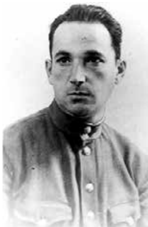
Slika 48: Aleksander Pečerski