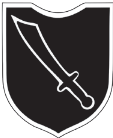
Slika 7: Bojni nož handžar na simbolu 13. divizije SS, po katerem je dobila ime.

Aprila 1943 je na pomoč pri rekrutiranju muslimanov v Bosno prišel jeruzalemski veliki mufti Mohamed Amin Al Husajni (Mohammad Amin al-Husayni; 1897, Jeruzalem - 1974, Bejrut). 19 Al Husajni se je v prvi svetovni vojni boril na strani Osmanskega cesarstva, od zgodnjih dvajsetih let 20. stoletja pa je aktivno sodeloval v antisemitskem gibanju na Bližnjem vzhodu. Leta 1921 je, star komaj 24 let, postal jeruzalemski veliki mufti, najvišji predstavnik islamske skupnosti. 20 Do leta 1937 je deloval v britanski mandadni Palestini, kjer je kot vnet arabski nacionalist močno nasprotoval sionističnemu gibanju, potem pa je moral od tam zbežati zaradi svojega protibritanskega vedenja. Najprej je odšel v Libanon in Irak, med drugo svetovno vojno pa je zatočišče našel v fašistični Italiji in Nemčiji. 21