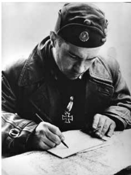
Slika 9: Vjekoslav Maks Luburić – »general Drinjanin«, između 1941. – 1945.

Tako su ustaše (ukupno oko 1200 vojnika, od kojih je dio bio stacioniran u Jasenovcu) samo pričekale da iz Zagreba stigne Maks Luburić pa su 8. i 9. siječnja 1942. pod njegovim vodstvom, uz prethodnu artiljerijsku pripremu, prešle Savu i krenule na Gradinu, Draksenić i okolna sela.