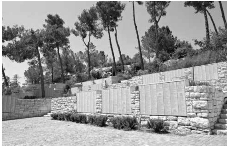
Slika 35: U parku Yad Vashema je i Zid časti s imenima pravednika među narodima.

početkom svake godine ukupno je do danas proglašeno 27 362 pravednika (stanje 1. siječnja 2019.). Najviše ih je iz Poljske 6992, potom Nizozemske 5778, Francuske 4099, Ukrajine 2634, Belgije 1751, dok je iz Mađarske 867, Italije 714, Slovačke 602, Bjelorusije 660, Njemačke 627. 33 Iz zemalja s prostora bivše Jugoslavije, najviše proglašeni pravednika je iz Srbije 139, Hrvatske 118, Bosne i Hercegovine 47, potom Slovenije 15, Makedonije 10, te Crne Gore 1. 34