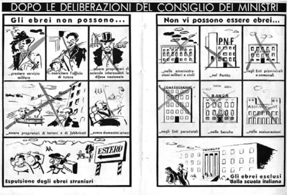
Slika 3: Antisemitska karikatura, na kateri je prikazanih 13 prepovedi za Jude v skladu s sprejetimi italijanskimi rasnimi zakoni. Karikatura je bila objavljena v reviji La Difesa della razza: Scienza, documentazione, polemica, questionario dne 20. novembra v XVII. letu fašistične vladavine (1938).