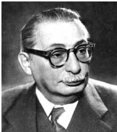
Slika 12: Moša Pijade

na primjer, bečki neuropsihijatar Viktor Emil Frankl (Beč, 1905. – Beč, 1997.), logoraš u Theresienstadtu, Auschwitzu i u ispostavama konclogora Dachau u Kauferingu i Türkheimu, saznao je nakon povratka u Beč za stradanje majke i njegove prve supruge (u logorima smrti). 15 Frankl je poznat po logoterapijski »školi« koja je nakon rata nadahnjivala metode psihoterapije traumi: preživjeli zatočenici nacističkih koncentracijskih logora nisu se mogli nadati psihoterapijske pomoći te su se morali naučiti živjeti s njima. 16