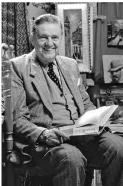
Slika 37: Prof. dr. Žarko Dolinar u svom stanu u Baselu 2002. godine (Foto: Ivan Stjepan Ivić, fotografija u boji; dostupno na: https://commons.wikimedia.org/wiki/File:Prof_dr_zarko_dolinar.jpg )