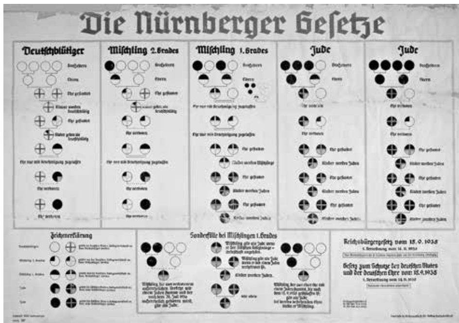
Slika 1: Razpredelnica z natančno opredelitvijo rasnih kategorij »celi Jud«, »Poljud« in »mešanec druge stopnje«, kot so bile določene s posebno uredbo k Zakonu o državljanih rajha .

V noči z 9. na 10. november 1938 je nacistično preganjanje Judov doseglo novo stopnjo, v zgodovini pisju znano kot »kristalna noč« (nem. Kristallnacht ). Pripadniki nacističnih paravojaških enot in Hitlerjeve mladine so napadli in oropali številne judovske trgovine po Nemčiji in jim razbili izložbena okna. Od tod izraz »kristalna noč«. Obenem so širom države aretirali nekaj deset tisoč Judov, jih zaprli v koncentracijska taborišča in zažgali več kot 1200 sinagog po vsej Nemčiji. Temu je takoj sledila popolna arizacija, torej popolno ekonomsko uničenje judovskega kapitala in izključitev Judov iz javnega življenja. Tako niso več smeli obiskovati javnih prireditelj, kot so koncerti, muzejev, gledališč. Ob koncu leta 1938 so jim tudi dokončno prepovedali obiskovati univerze. 11