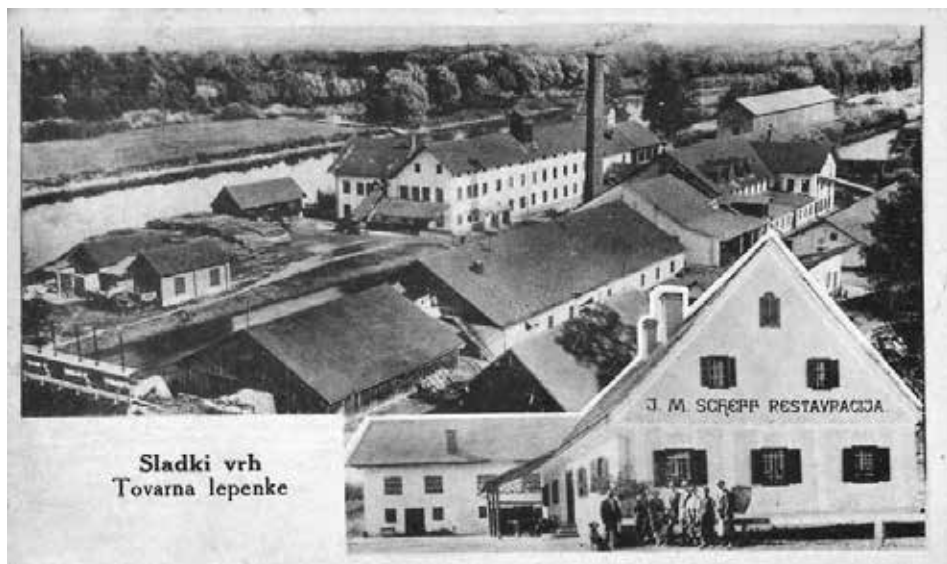
Slika 19: Razglednica Tovarne lepenke v Sladkem Vrhu, ki je bila odposlana leta 1937.