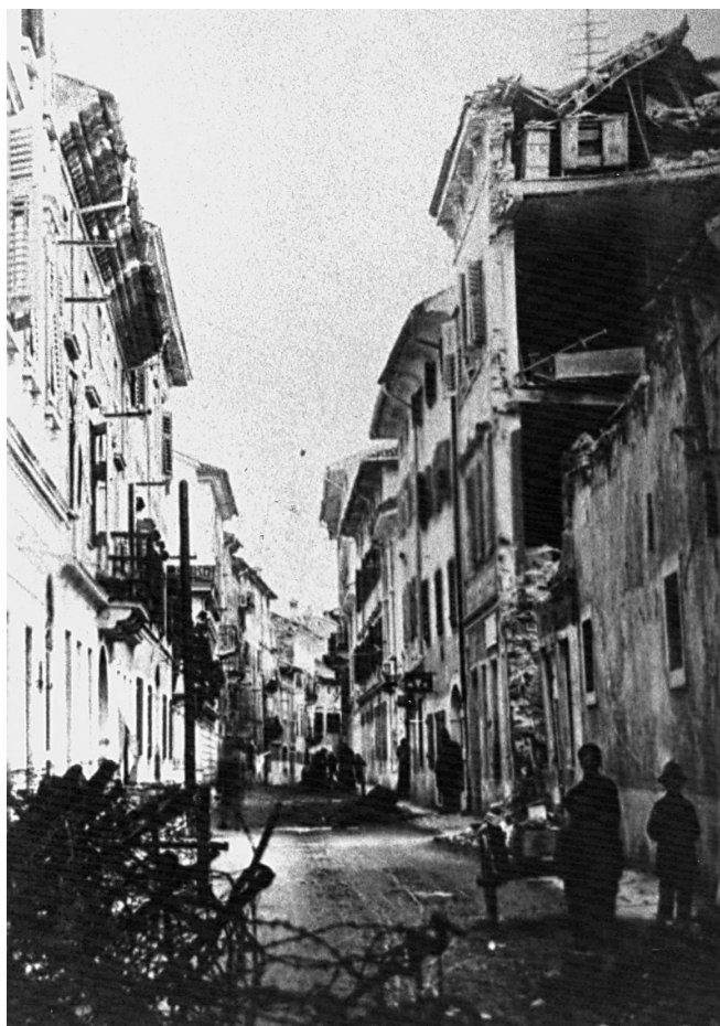
Slika 3: Nekdanji geto v Gorici med prvo svetovno vojno