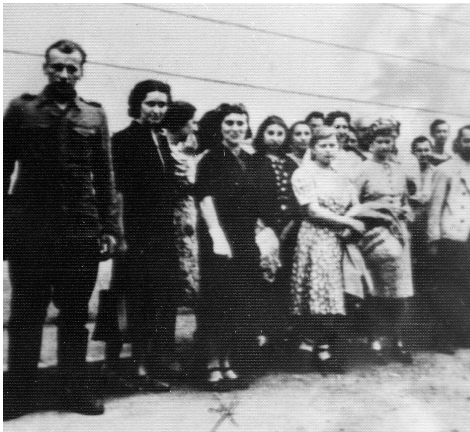
Slika 7: Prisilno delo