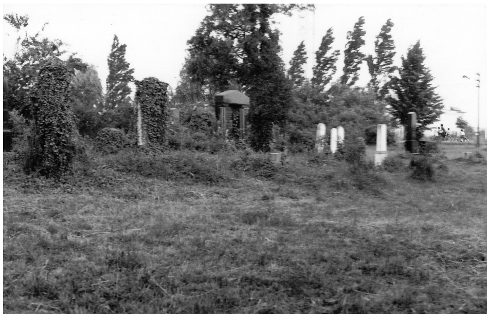
Slika 2: Judovsko pokopališče v Murski Soboti po drugi svetovni vojni