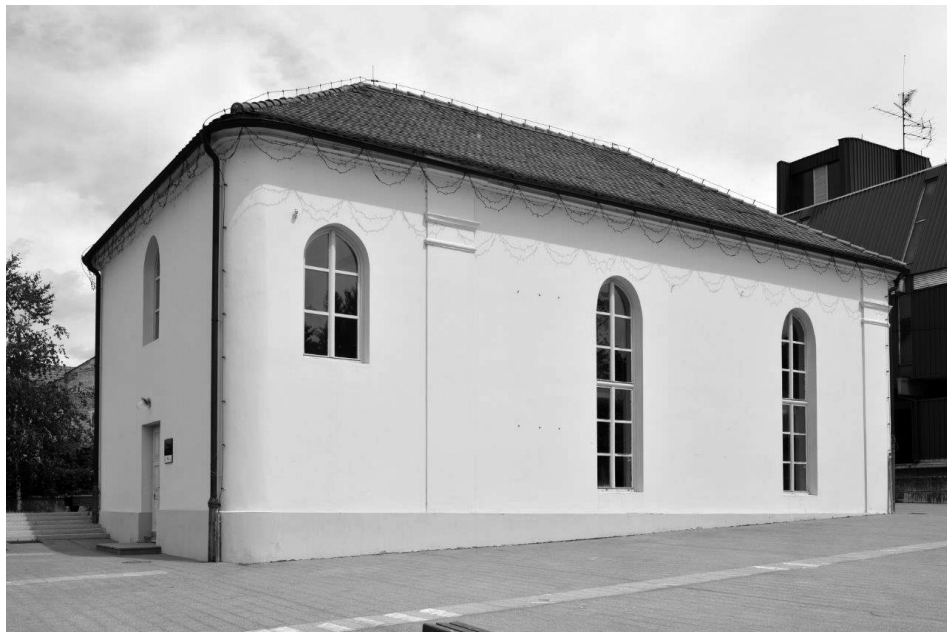
Slika 1: Sinagoga v Lendavi