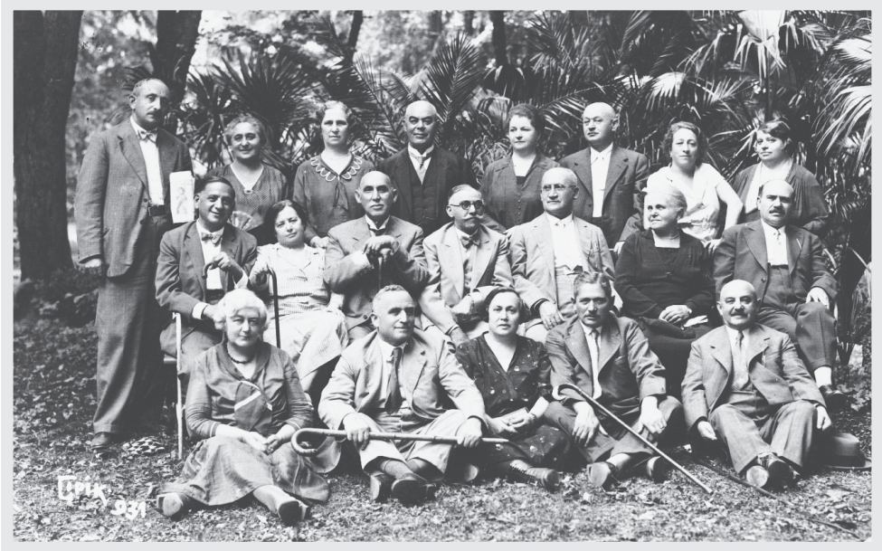
➤ Skupina osječkih Židova