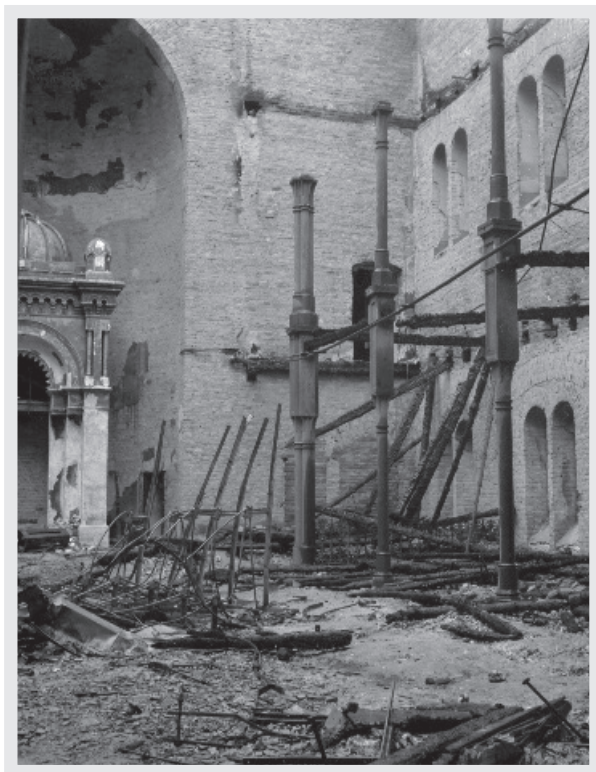
➤ Spaljena gornjogradská sinagoga