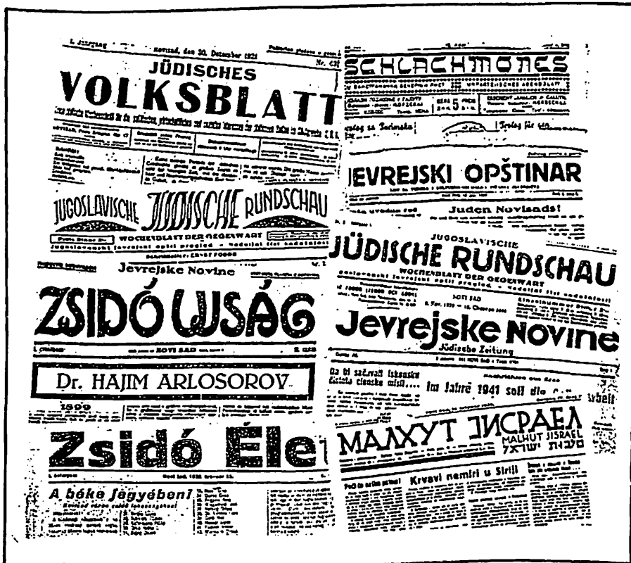
מקבץ מהעתונות היהודית משנות ה-20 וה-30