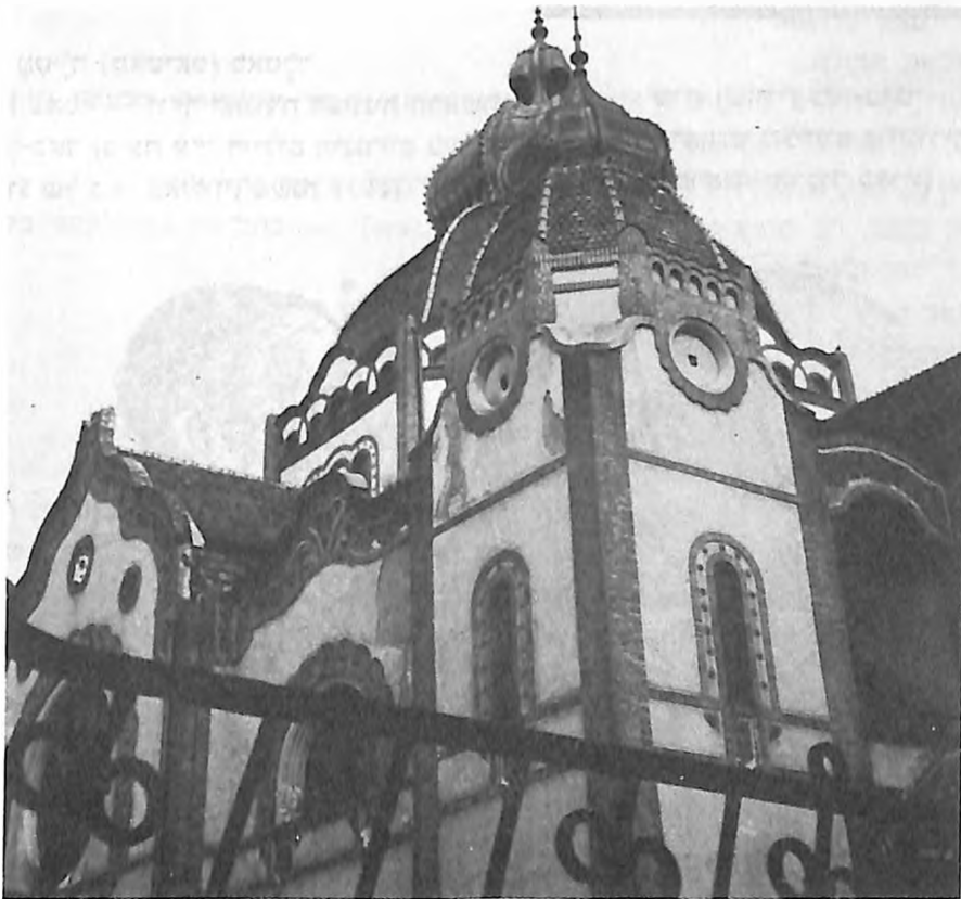
מראה של בית-הכנסת של סובוטיצה