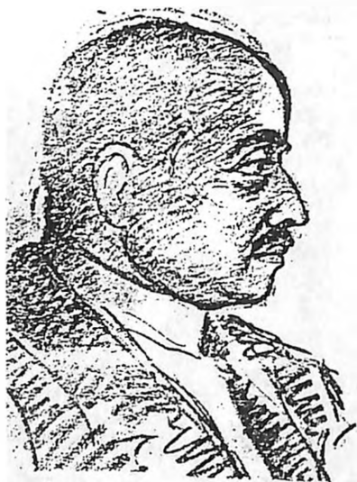
ד"ר פרדיננד (ננדור) לוסטיג (ציורו של באלאז')