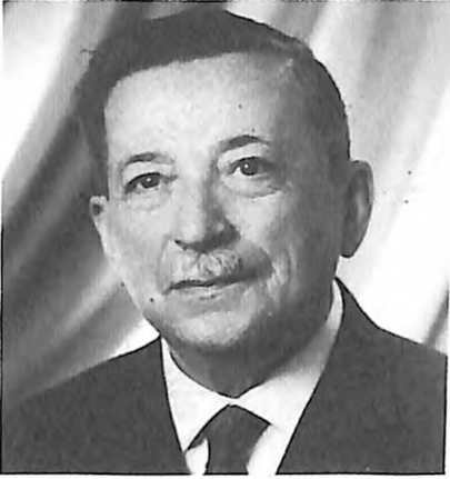
לודויג (לאיוש) קורודי מנהיג ציוני בנובי-סאד