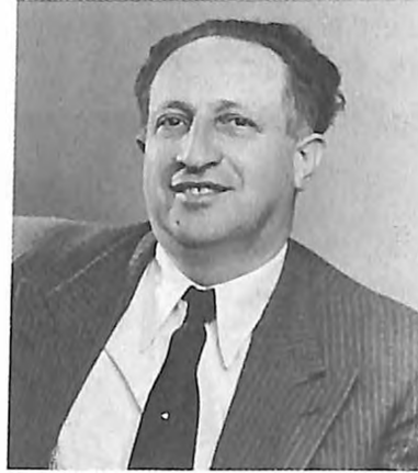
ד"ר מאיר תובל (וולטמן) מנהיג ציוני בנוטי-סאד