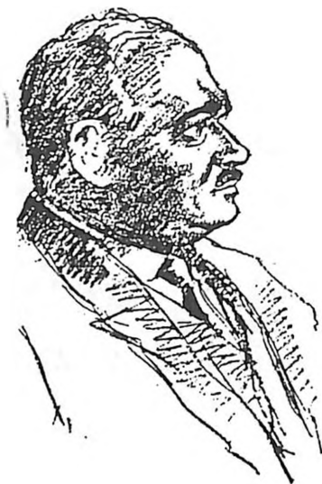
ד"ר מטייה (מאטיאס) סאטלר רופא עממי — יו"ר האגודה הציונית הראשונה בנובי-סאד (נרצח ע"י חיילים הונגריים בינואר 1942) (ציורו של ג.א. באלאז', משנת 1929)