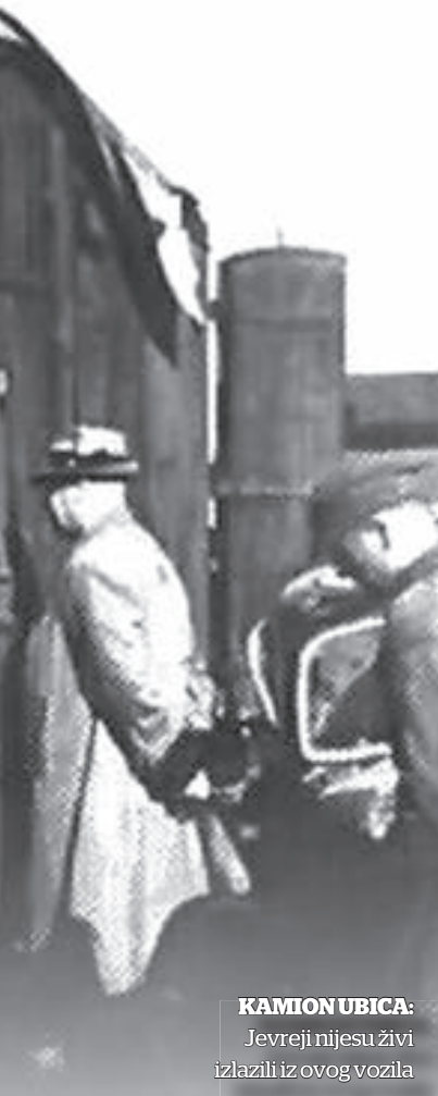
KAMION UBICA: Jevreji nijesu živi izlazili iz ovog vozila