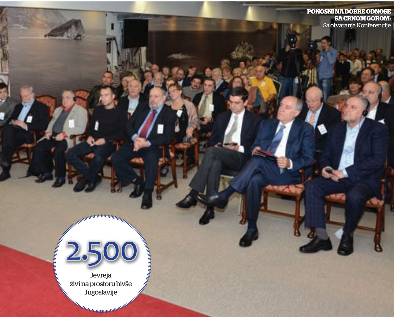
PONOSNINA DOBRE ODNOSI SA CRNOM GOROM: Sa otvaranja Konferencije