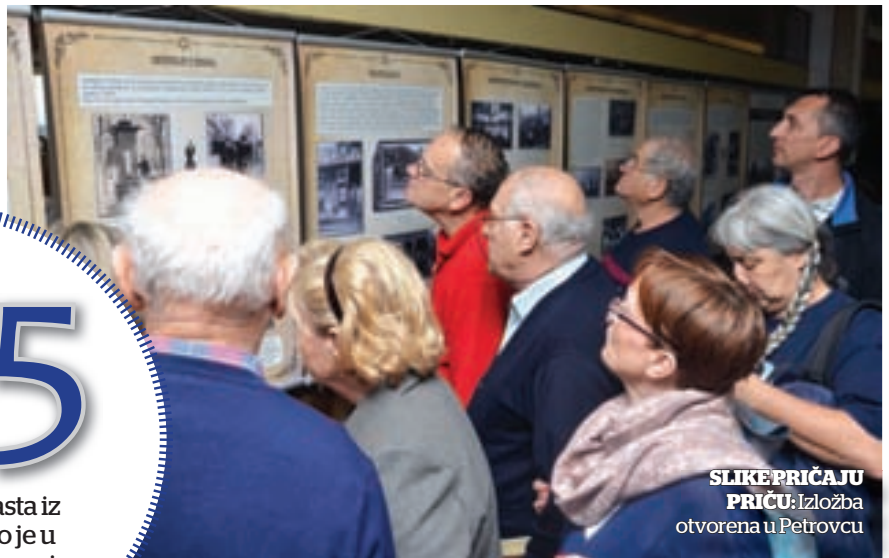
SLIKE PRIČAJU PRIČU: Izložba otvorena u Petrovcu