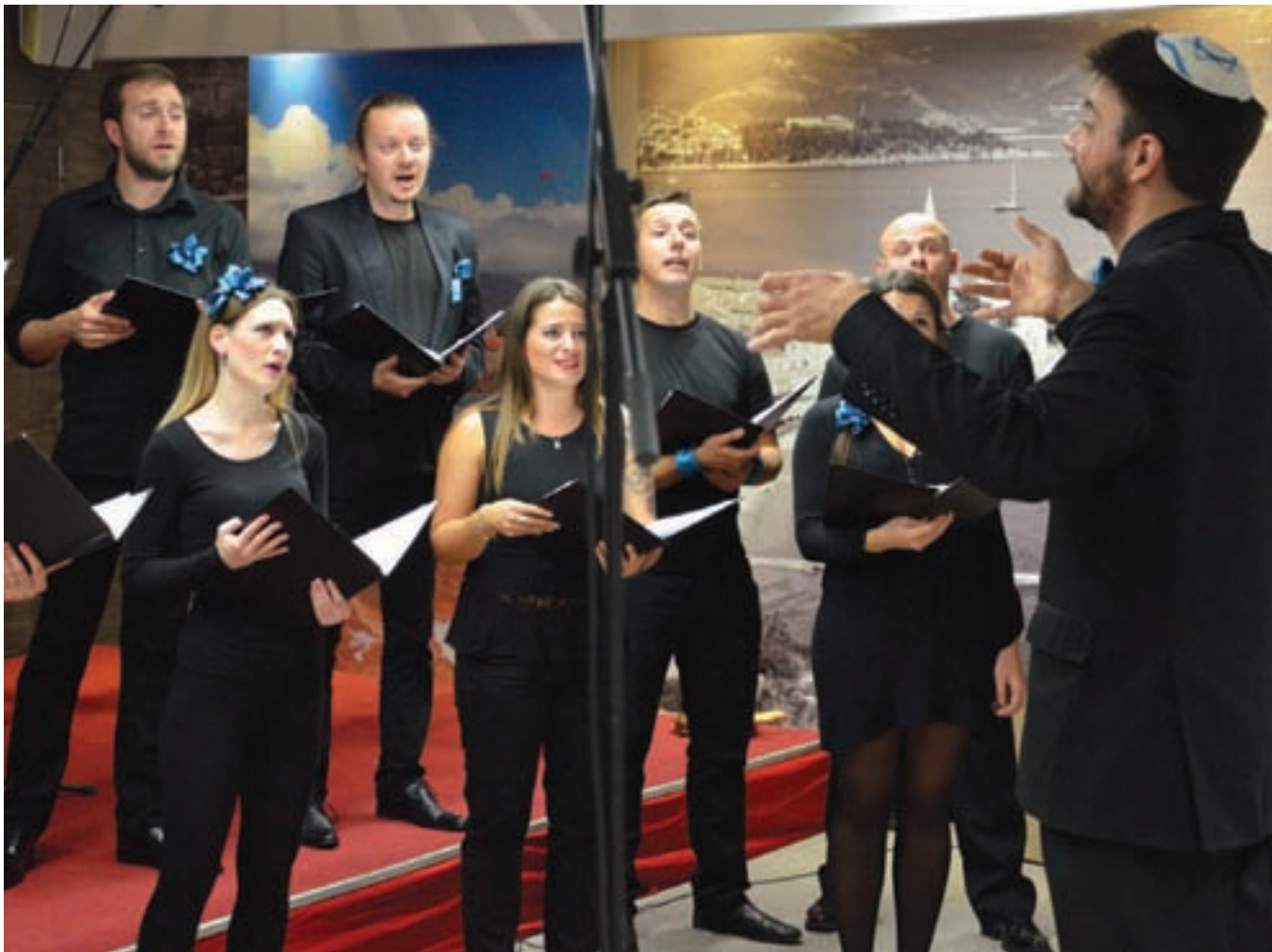
Neki istraživači tvrde da je hor iz Beograda najstariji jevrejski hor na svijetu

Učesnici treće Konferencije zajednica Jevreja sa prostora bivše Jugoslavije i njihovi gosti bili su u prilici da u okviru programa „Mahar 2015“ uživaju u nastupu Srpsko-jevrejskog pjevačkog društva „Braća Baruh“ iz Beograda. Riječ je o horu za koji neki istraživači tvrde da je najstariji jevrejski hor na svijetu.