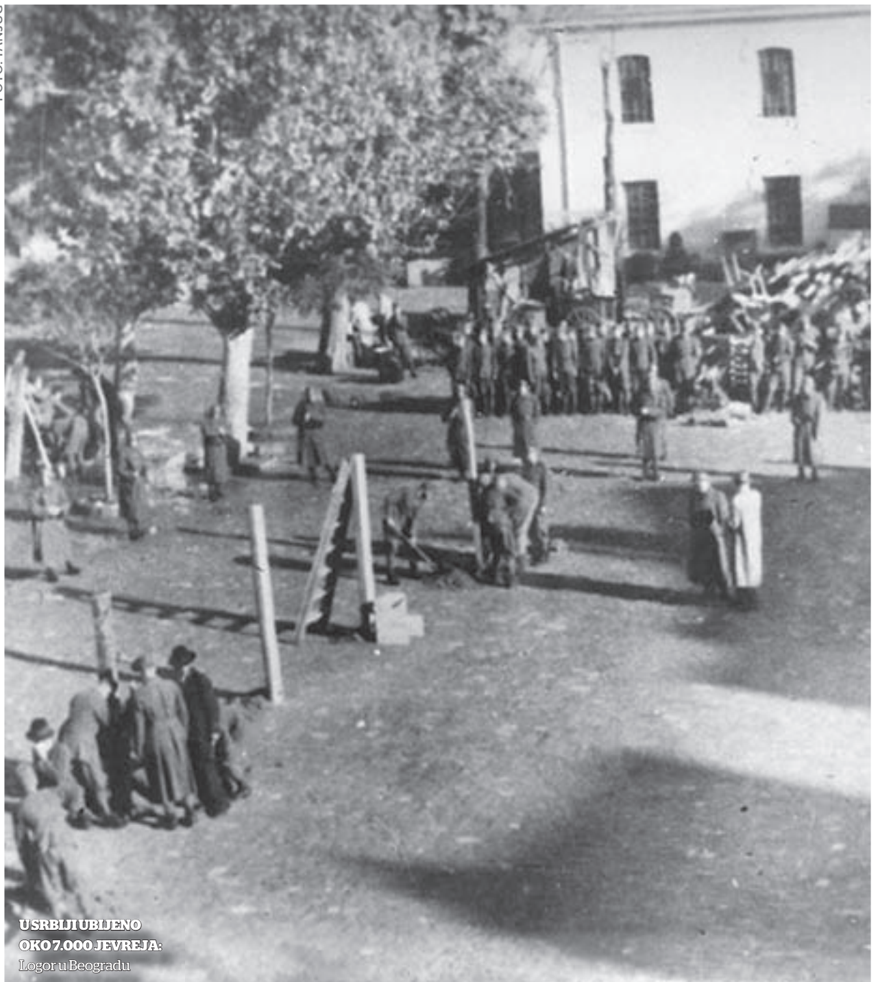
U SRBIJI UBLJENO OKO 7.000 JEVREJA: Logor u Beogradu