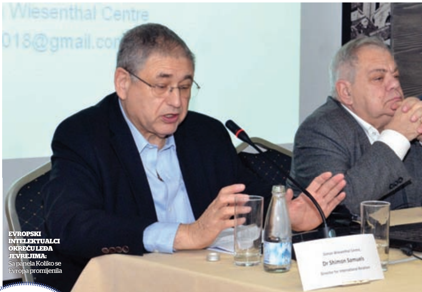
EVROPSKI INTELEKTUALCI OKREĆUJEĆA JEVREJIMA: Sa panela Koliko se Evropa promijenila

On je objasnio da je treći talas terorističkog antisemitizma pokrenula „demografija“, a ne migranti. - U pitanju su ljudi koji su rođeni u Evropi. Cijela generacija tih ljudi osjeća da je odbacena od društva, oni traže identitet kroz džihadizam koji je primarno antisemitizam i neraskidivo antizapadni, antievropski, antihrišćanski, pa ako hoćete i protiv žena i homoseksualaca – rekao je Samuels. On je objasnio da teroristi shvataju da su Jevreji „neizbježna taktička meta“. - Ako su Jevreji taktička meta, šta je onda strateška meta? Strateška meta jesu suštinske vrijednosti i vrlo krhko tkivo zapadne demokratije. Ti teroristi se udružuju protiv toga – upozorio je on. Samuels je podsjetio na riječi Simona Vizentala koji je rekao „da ono što počne sa Jevrejima, nikada se ne