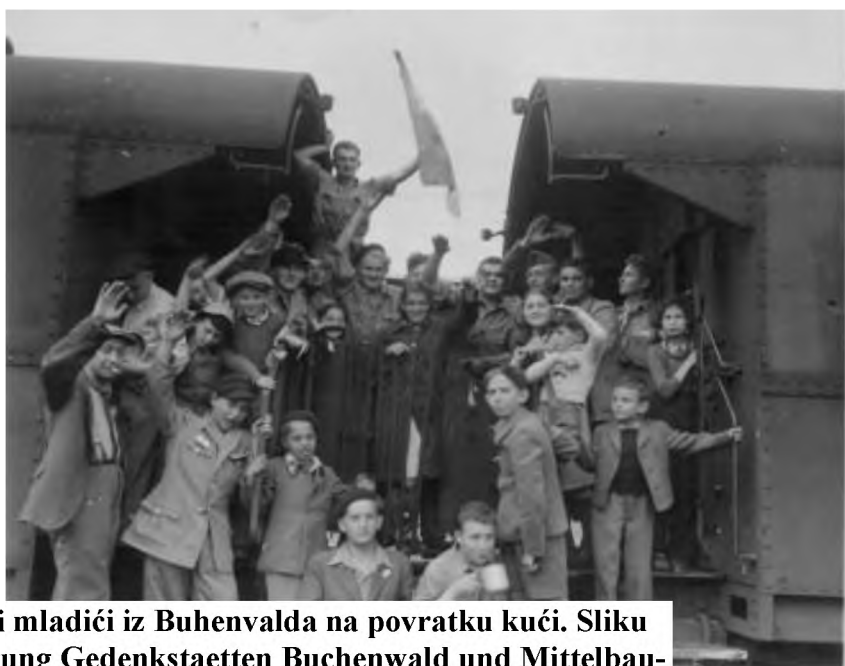
Oslobođeni mladići iz Buhenvalda na povratku kući.

Madžarski režiser Ferenc Török je svojim filmom s lapidarnim naslovom „1945“ (2017.godine) međunarodnu publiku sučeljavao s događajem, što ga je neposredno nakon završetka rata rijetko tko očekivao: Vratili su se preživjeli iz logora smrti, pojavili bi se pred svojim bivšim stanovima i kućama. Dvojica, starac i mladić, banu u pripreme za seosku svadbu na zaprepasćenje seljana. Oni sve godine rata nisu razmišljali o daljnjom sudbinom onih, čijim su deportacijama namjerno-nenamjerno postali svjedocima. Mještani na dvojicu povratnika gledaju kao na aveti iz grobova, uznemireni, jer u malome selu svako znade sve o svakome. Tko je koga demuncirao, tko je mogao pomagati, a nije pomagao, tko je okrenuo glavu. Neki se tvrdoglavo pouzdaju u „nova vremena“ i nove vlasti, a ujedno se svi boje da će se preživjeli osvetiti. I došljaci shvaćaju da su gosti iz drugog vremena, kao s drugog planeta. Okrenu se i odlaze iz svijeta koji više nije njihov -kamo, to ostaje gledatelju da se zamišlja.