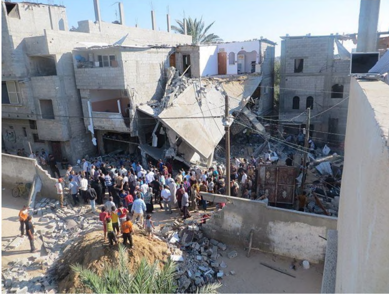
Ruined houses in Gaza

Former homeowners from Sheikh Jarrah as well as some ultra-right associations referring to this law that guarantees the private property of Israeli citizens, appealed to the court which announced the eviction of longtime residents of these houses from Sheikh Jarrah. All this happens during the month of Ramadan when tensions in Jerusalem are at their peak and even more so on Lailat el Qadr (27 nights which is one of the most important holidays for Muslim believers) when tens of thousands of believers