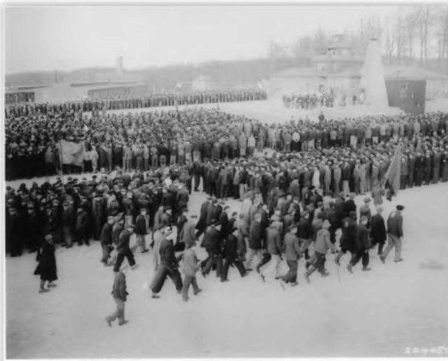
Die Überlebenden aus Auschwitz verließen das Lager.

Der ungarische Regisseur Ferenc Török konfrontierte seinen Film mit dem lapidaren Titel „1945“ (2017) das internationale Publikum mit einem Ereignis, das bei Kriegsende kaum jemand erwartet hatte: Aus den Todeslagern der Nazis kehrten Überlebende in ihre früheren Wohnorte zurück, tauchten vor ihren Häusern und in ihren Ortschaften auf – zur Beklemmung der neuen Bewohner. Diese hatten sich während des Krieges, als sie nach dem Abtransport der Eigentümer diese Objekte in Beschlag nahmen, nicht den Kopf darüber zerbrochen, wohin die Transporte wohl gehen mochten und was mit den „Reisenden“ weiter geschehen mochte. Die Bauern in einem ungarischen Dorf reagierten auf die Ankunft zweier Juden peinlich berührt: