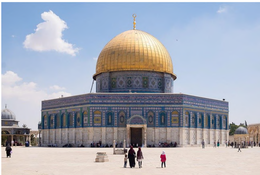
Kupola na stijeni u Jeruzalemu, mjesto početka nedavnih sukoba

Jeruzalem. Što se tiče arapskih kuća koje su Arapi napustili u zapadnom Jeruzalemu bježeći u istočni dio grada, država Izrael im nikada nije dala pravo da se u te kuće vrate, a njihova imovina je konfiscirana uz obrazloženje da su arapski vlasnici imovine iz zapadnog Jeruzalema bili odsutni nakon događaja koji su doveli do uspostavljanja države Izrael. Ovaj zakon se nije