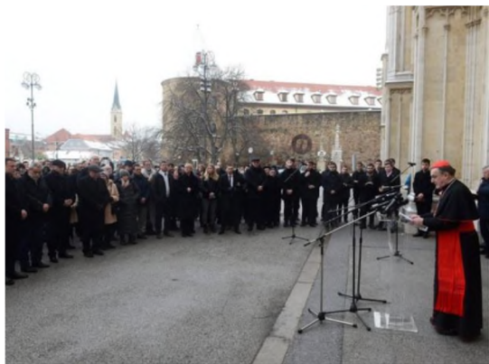
Commemoration in front of Zagreb Cathedral

The memory to the victims of the Holocaust has been marked this year in Croatia more strongly than in past years. There were many gatherings in various Croatian cities organized by both Jewish and non-Jewish associations. The attention of the public and the media, however, was most impressed by the surprising set-up before the cathedral in Zagreb organized by the Catholic Church. Cardinal Bozanić, who in his speech explicitly condemned the crimes in the notorious Ustasha camp Jasenovac during the Holocaust, contributed to a pleasant surprise. Here are few sentences from the Cardinal's speech: