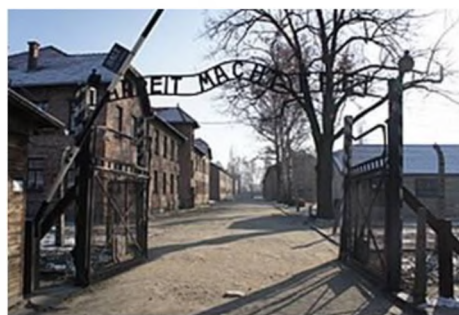
Entrance to Auschwitz