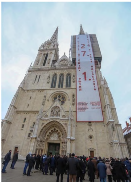
The Banner on Zagreb Cathedral

Dan sjećanja na žrtve Holokausta obilježen je ove godine u Hrvatskoj mnogo snažnije nego proteklih godina. Bilo je mnogo skupova u raznim hrvatskim gradovima u organizaciji i židovskih i nežidovskih udruga. Pažnju javnosti i medija ipak je najviše privukao iznenađujući skup pred zagrebačkom katedralom u organizaciji katoličke crkve. Ugodnom iznenađenju doprinjeo je sam kardinal Bozanić koji je u svom govoru izričito osudio zločine u notornom ustaškom logoru Jasenovac za vrijeme Holokausta. Evo nekoliko rečenica iz kardinalovog govora: