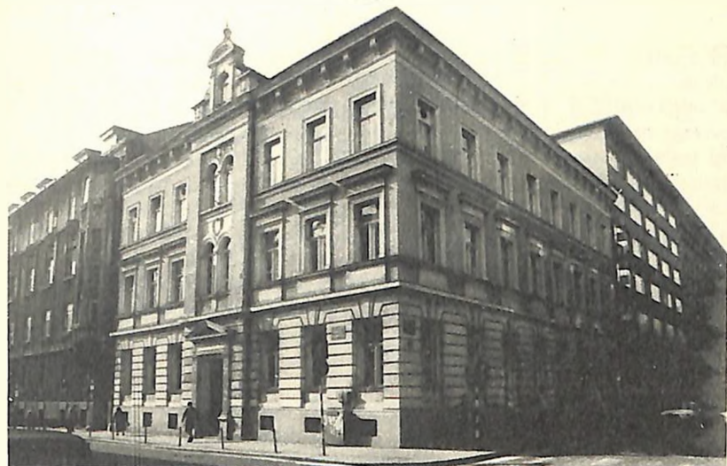
Zgrada Jevrejske općine u Zagrebu, Palmotićeva 16

djeca su učila i ručni rad, a velika prostorija u prizemlju postala je vrtić za predškolsku djecu pod vodstvom Mirjane Weiller, odličnog pedagoga.