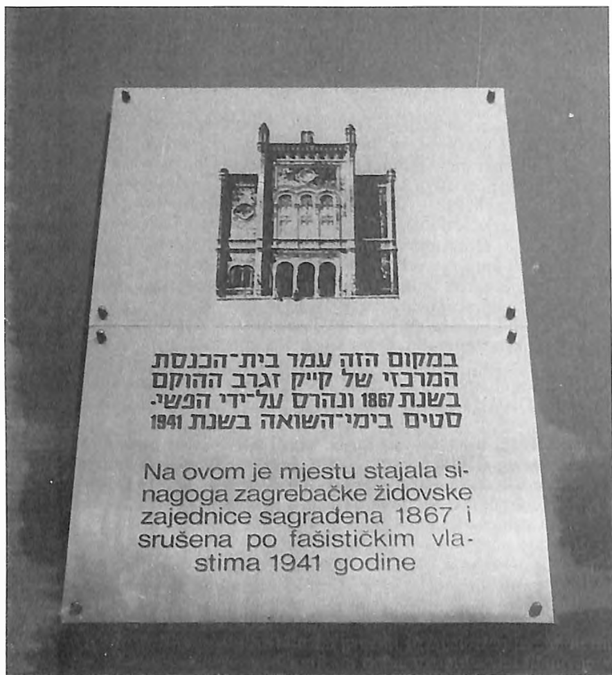
Spomen-ploča u Praškoj ul. 7 gdje se nalazila sinagoga srušena 1941. godine.