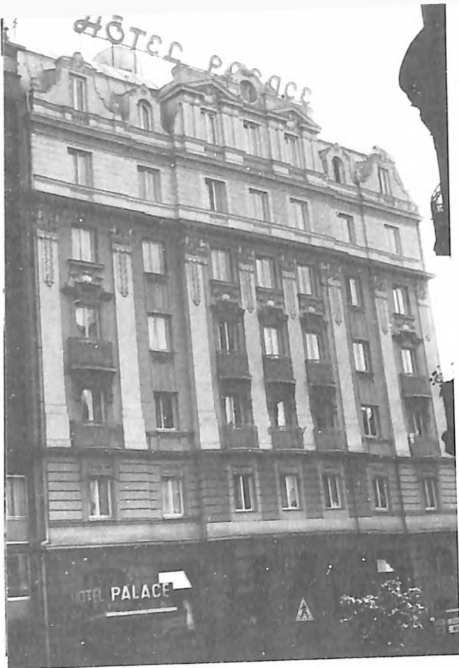
L. Talvi, Hotel "Palas", Topličin venac 23, današnji izgled