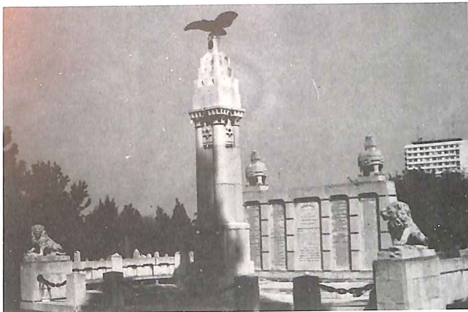
S. Sumbul, Spomenik Jevrejima palim u I svetskom ratu, jevrejsko groblje, Ruzveltova ulica, današnji izgled