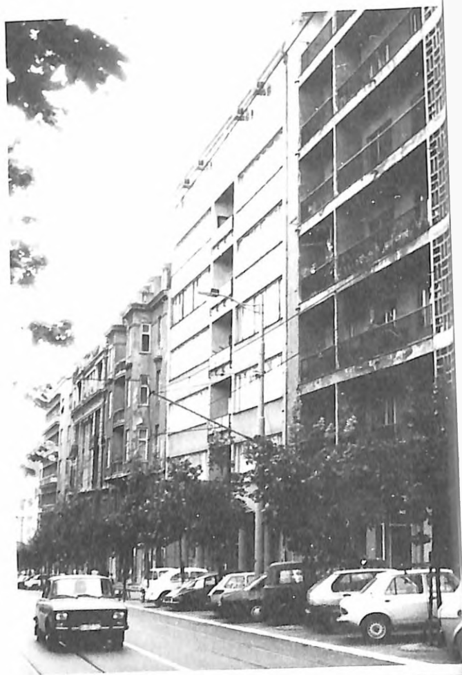
E. Vajsman, Dom novinara (danas Tanjug), Generala Ždanova 28, današnji izgled