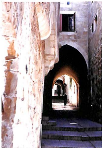
Put ka molitvi

Bavi se ilustrovanjem , opremom knjiga i slikanjem. Studijska putovanja: Italija, Grčka, Francuska i Izrael. Mnogobrojne samostalne i grupne izložbe. Dobitnik je dve godišnje nagrade ULUPUDS-a 1993. g. i 2003. g. za likovna ostvarenja.