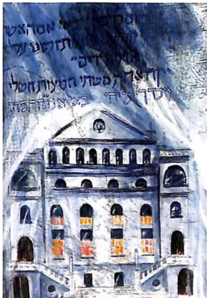
Beogradska sinagoga 1