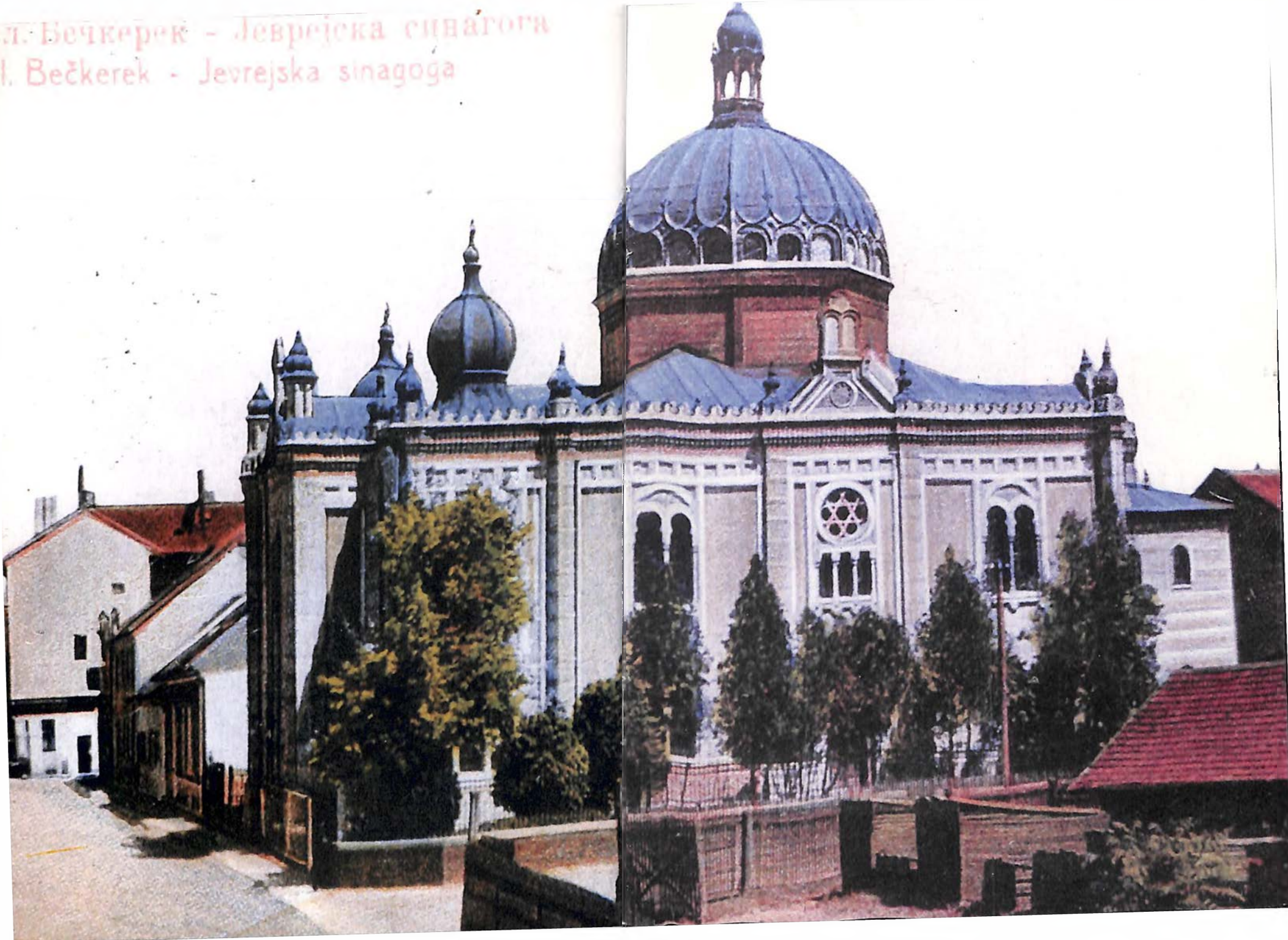
el. Bečkerek - Јеврејска синагога el. Bečkerek - Јеврејска sinagoga