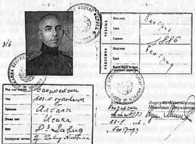
Vojna knjižica iz 1936. godine

žnost, a kada ustreba i da pođe u rat. Misao da bude aktivan borac i ratnik, da brani slobodu i bezbednost svoje domovine, – ta misao ispunjavala ga je radošću i ponosom. Pomenula sam već s kakvom je gotovošću, upravo s kakvom je radošću on pošao i u Balkanski i u Prvi Svetski Rat. Kada je naša zemlja zaratila u Drugom svetskom ratu, ma da su ga i njegove godine i okeani razdvajali od našeg ratišta, on je, u