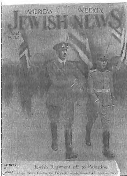
Parada na Petoj aveniji u Njujorku 1917. g.