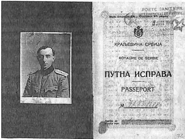
Pasoš iz 1917. godine

i držati javne govore. Da se jedan mladi čovek celog svog veka pripremao za političku misiju u inostranstvu, svakako ne bi bio bolje pripremljen niti bi bio pogodniji za svoju dužnost. Doista, mudri Pašić nije se prevario kada je, umesto profesionalnih diplomata, poslao u ovom značajnom istorijskom trenutku lekara vatrenog rodoljuba i Jevrejina doktora Albalu po državnom poslu u Ameriku.