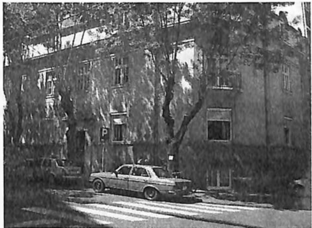
Kuća na uglu ulica Visokog Stevana i Jevrejske (sadašnji izgled)

Ne samo što smo u stanu imali više prozora nego iko, – no on nije dopuštao da uopšte imamo zavesa „da mu se ne bi uskratila svetlost“. I kada sam najzad, posle više godina, izjavila da stavim zavesu, one su morale biti samo bele ili svetlo bež, i to sasvim šupljikave ili čipkaste. Jednom se čak naljutio što mu zavesa zamračuje svetlost – dan je bio upravo oblačan, jesenji, – i zderao ju je.