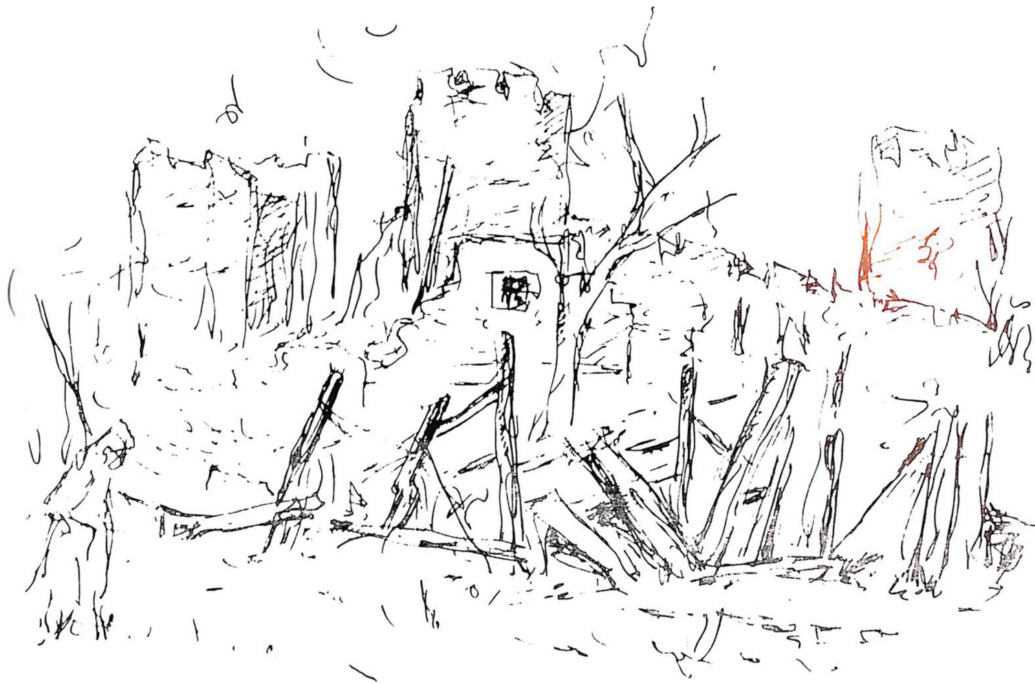
Bora Baruh, Raščišćavanje ruševina u Smederevu , tuš, 1941, 18,5 x 14 cm, bez signature: vlasnik Sonja Baruh