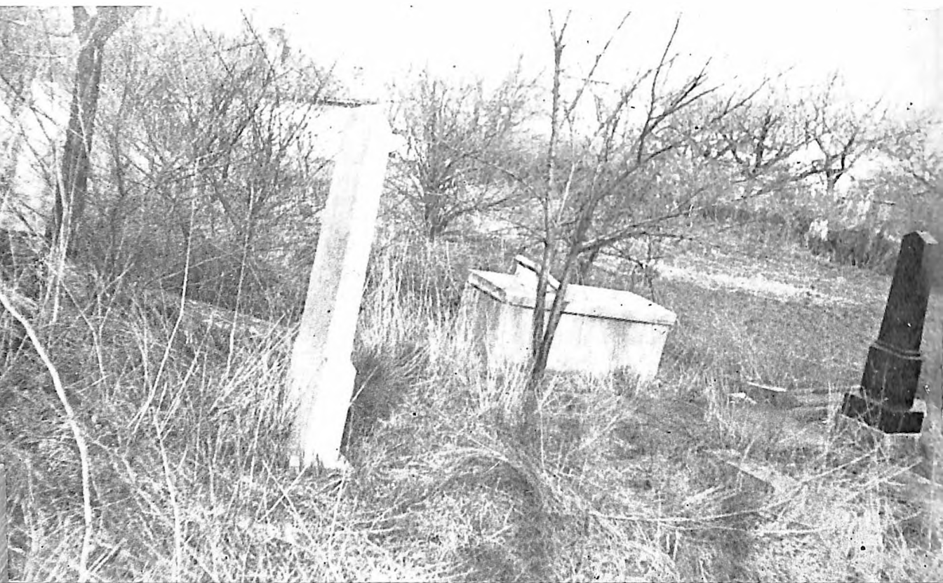
2. Deo jevrejskog groblja u Smederevu, snimak iz 1977. godine