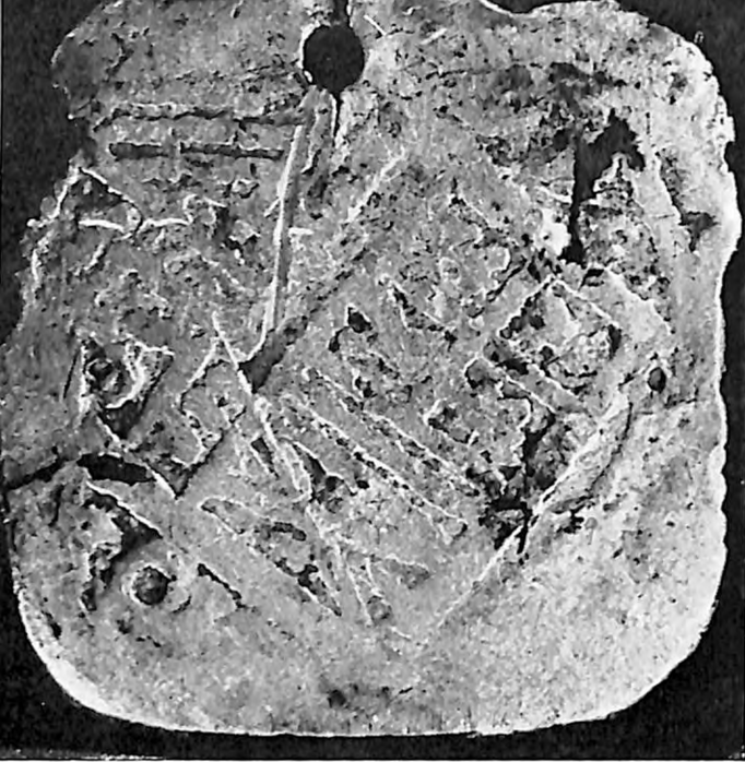
1. Španski talir koji su doneli Jevreji po dolasku u Smederevo (oblik mu je izmenjen)