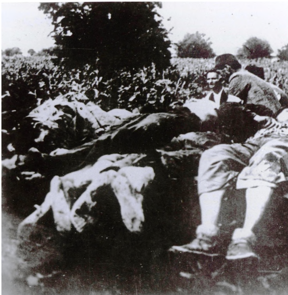
Сакупљање лешева, усташких жртава код Приједора, август 1941.

грађана Приједора и околине. На овом мјесту сахрањене су 833 жртве усташког геноцида“. 90