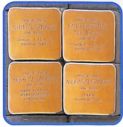
ra / "Stolpersteine" by German artist Gunter Demning