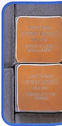
"Камен спотицања" - дело немачког аутора Гунтера Демни