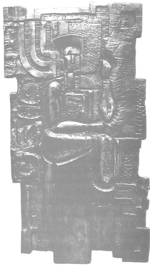
10. IZ CIKLUSA "VIZIJA" I, 1972.