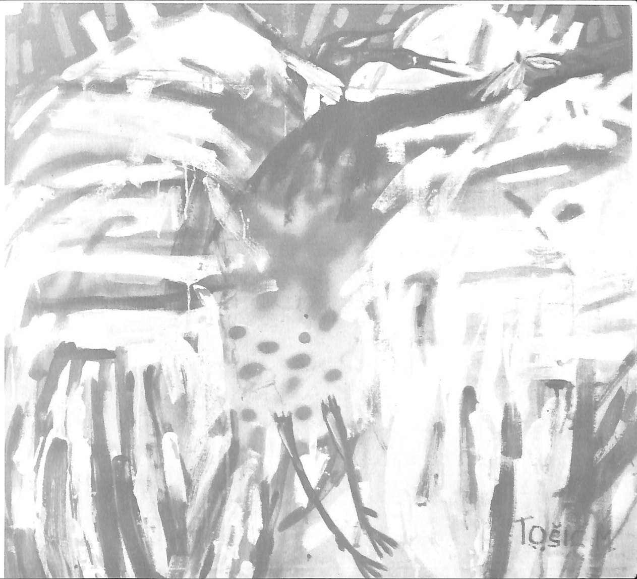
27. DVIJE PTICE I DVIJE NOGE, 1991.