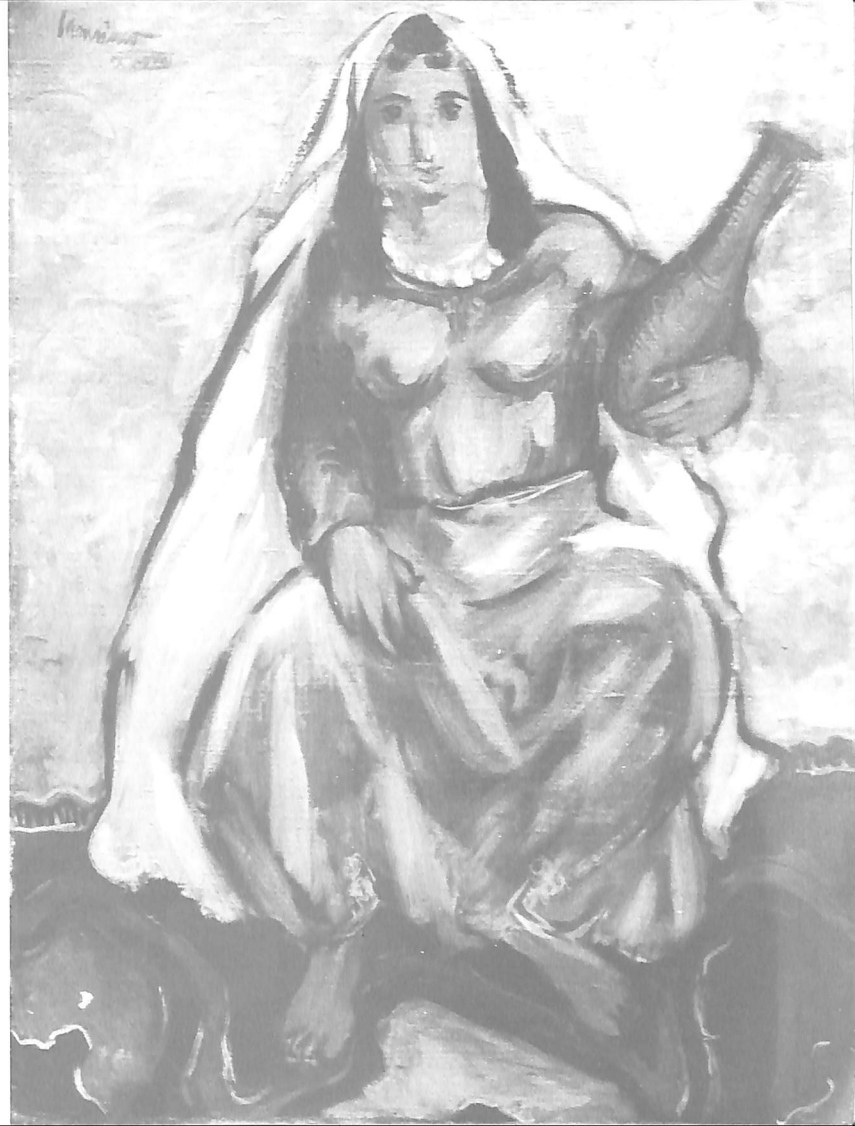
17. MAROKANKA, 1938.